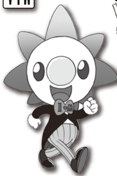
一宮モーニング 公式キャラクター ICHIMO(イチモ)