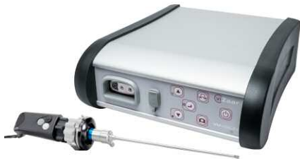
Kit VUVISION + VUHD-CAM

Tous les sondes FSC-2 et VUSCOPE sont compatibles! including transportation- and storage case.