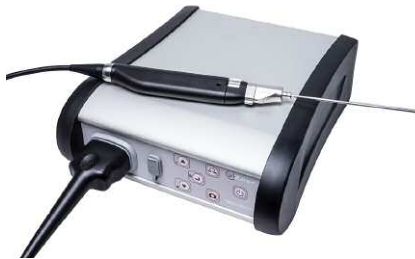
Kit VUVISION + VUSCOPE