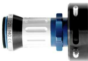
Adaptations pour caméras