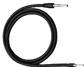
Guides de lumière