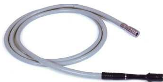
Guides de lumière