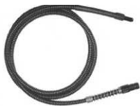
Guides de lumière