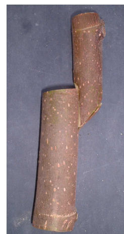
図 1 切り接ぎ