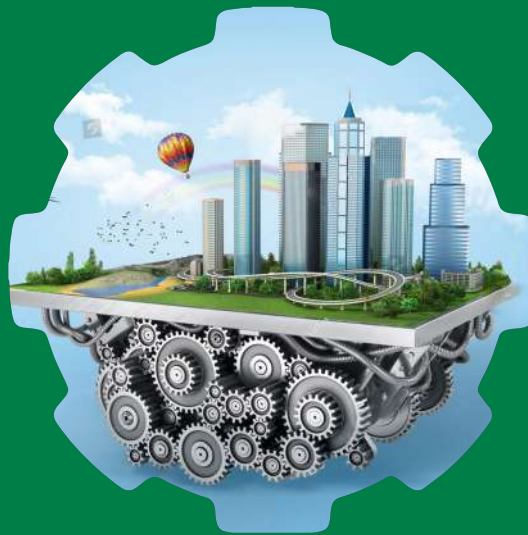
To be the engineering hub for Auto & machinery