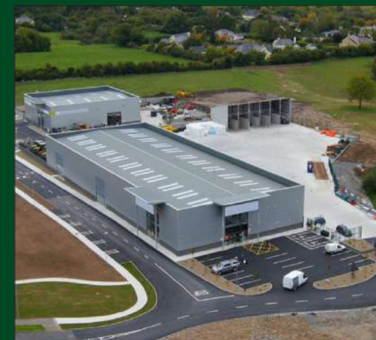
Mahindra World city Ponneri