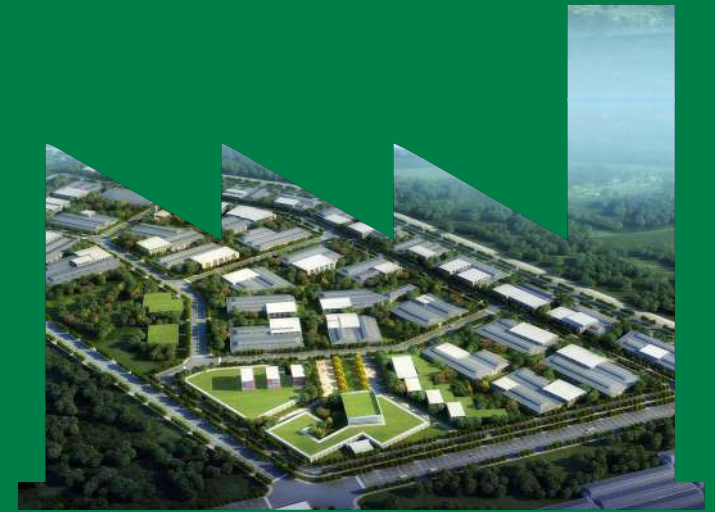
Ponneri NIMZ (National Investment & Manufacturing zone)