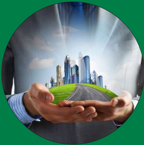
Top investment Destination Asia (Ponneri node)