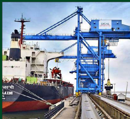
Kattuppali and Kamarajar ports