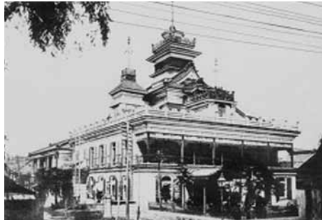
渋沢栄一が建てた第一国立銀行

に变身していた。中でも栄一の心を虜にしたのは、皇帝ナポレオン三世とセーヌ県知事オースマンによって進められているパリ市街の大改造工事であった。ヨーロッパの新しい力を象徴する近代都市に生まれ変わる瞬間に遭遇したのである。栄一はパリの地下が火