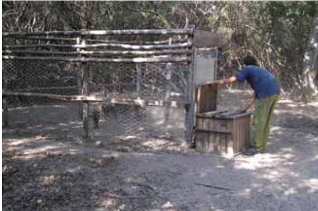
FIGURE 9 Capture de sangliers sauvages: les marcassins (< 30 kg) sont enfermés dans une caisse en bois, mais les animaux adultes doivent être anesthésiés