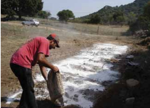
FIGURE 8 L'enfouissement profond est la méthode recommandée pour se débarrasser des carcasses afin d'éliminer le virus de l'environnement