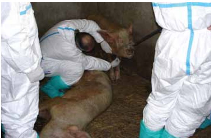
FIGURE 3 Prélèvement d'échantillons: Des prises de sang sont nécessaires aux fins du diagnostic et de la surveillance