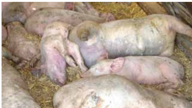
FIGURE 2 Premiers signes cliniques – les animaux ont de la fièvre, se blottissent les uns contre les autres et sont cyanosés