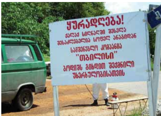
FIGURE 6 Zone infectée: contrôle des mouvements