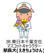
JR 東日本千葉支社 マスコットキャラクター 駅長犬(えきちょうけん)