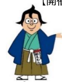
ふなばしセレクション PR キャラクター 目利き番頭 船えもん