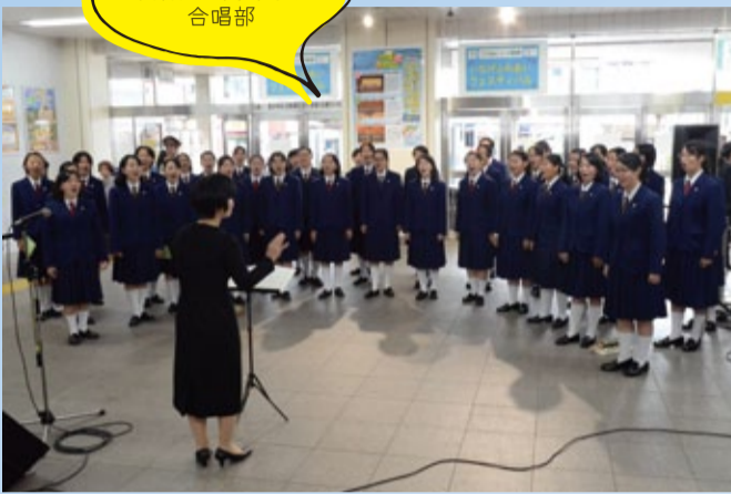
千葉県立 千葉女子高等学校 合唱部