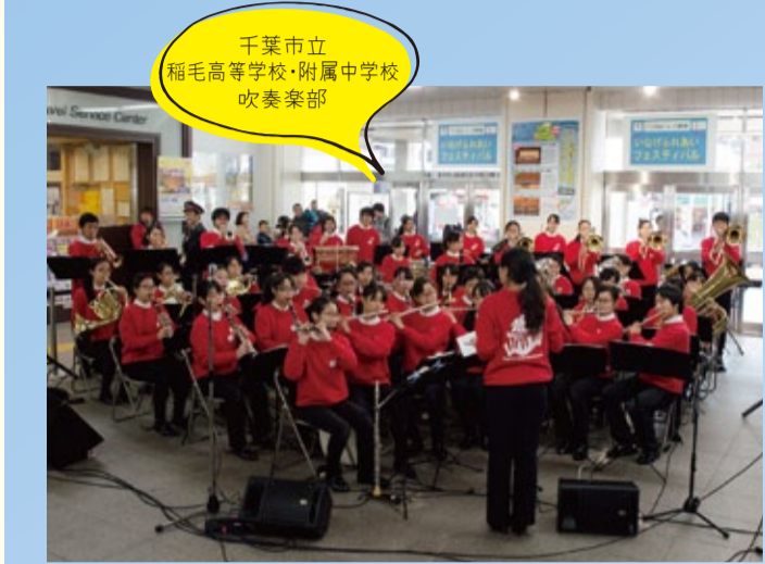
千葉市立 稲毛高等学校・附属中学校 吹奏楽部