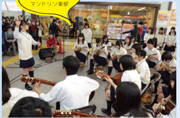
千葉県立 千葉東高等学校 マンドリン楽部

去る11月16日(日)、気持ちの良い秋晴れの中、JR稲毛駅構内にて「ふれあいフェスティバル2014」が開催されました。今年で3年目となる駅コンサートには、地元稲毛の三つの学校の生徒たちが参加し、素晴らしい演奏を披露してくれました。大勢の人々が足を止め、駅構内に響き渡る演奏に聞き惚れていました。