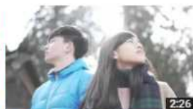
日本・北東北 遇見岩手 視聴回数 226 回・1週間前