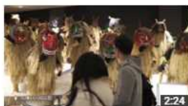
日本・北東北 遇見秋田 視聴回数 629 回・1週間前