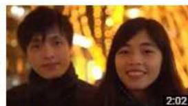
日本・北東北 遇見仙台 視聴回数 139 回・1週間前