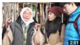
日本・北東北 遇見青森 視聴回数 219 回・1週間前