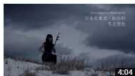
日本北東北・仙台の冬之景色 使用 台灣和日本的傳統樂器演奏 視聴回数 15 回・14時間前