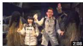
日本・北東北 白雪! 美食! 風景! 一起來體驗這個魅力城市 視聴回数 12 回・14時間前