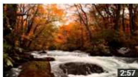
北東北・仙台的魅力 紅葉篇 1か月前・視聴回数 1,265 回