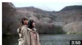
[4K] Beautiful scenery of AOMORI AKITA IWATE SENDAI 視聴回数 6 回・14時間前