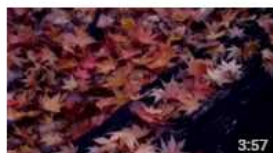
日本・北東北 在美麗的秋 視聴回数 5 回・14時間前