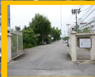
ทางเข้า - ออก