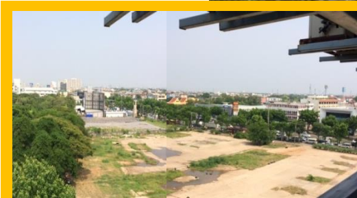
ภาพที่ดินบริเวณบิมน้ำมัน