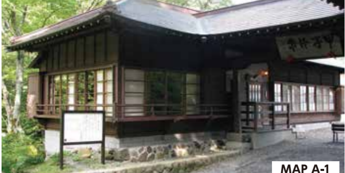
勝花亭 (しょうかてい) 松平定信公は甲子の風光をたいそう愛し、しばしば足を運び勝花亭はその折りの休泊所になったところでした。