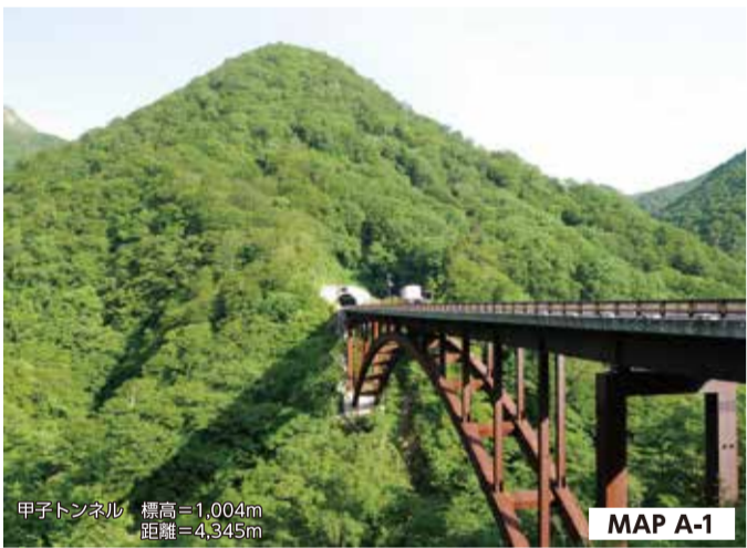
甲子大橋 (あかしおほし) 甲子大橋は、一般国道289号「甲子道路」の国土交通省事業区間終点側に位置する、橋長199mの長大橋です。新緑や紅葉の季節には周辺の山々を背景とした雄大な絶景が楽しめます。