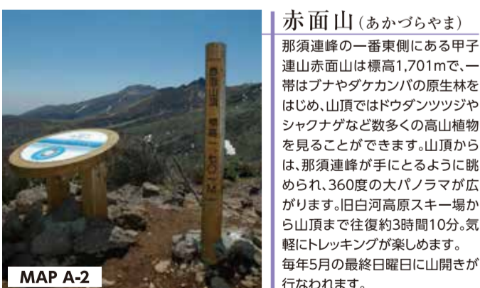
赤面山 (あかづらやま) 那須連峰の一番東側にある甲子連山赤面山は標高1,701mで、一帯はブナやダケカンパの原生林をはじめ、山頂ではドウダンツツジやジャクナゲなど数多くの高山植物を見ることが出来ます。山頂からは、那須連峰が手にとるように眺められ、360度の大パノラマが広がります。旧白河高原スキー場から山頂まで往復約3時間10分。気軽にトレッキングが楽しめます。毎年5月の最終日曜日に山開きが行なわれます。