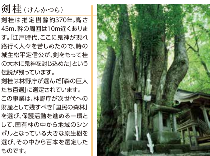
剣柱 (けんかつら) 剣柱は推定樹齢約370年。高さ45m。幹の周囲は10m近くあります。江戸時代、ここに鬼神が現れ路行く人々を苦しめたので、時の城主松平定信公が、剣をもって柱の大木に鬼神を封じ込めた」という伝説が残っています。剣柱は林野庁が進んだ「森の巨人たち百選」に選定されています。この事業は、林野庁が次世代への財産として残すべき「国民の森林」を選び、保護活動を進める一環として、国有林の中から地域のシンボルとなっている大きな原生樹を選び、その中から百本を選定したものです。