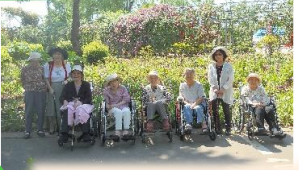
5月・バラ園ツアー