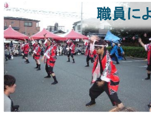
職員による出し物!