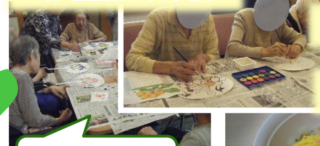
6月・各階合同・うちわ作り