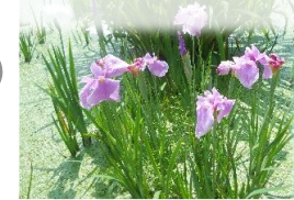
5・6月・菖蒲ツアー