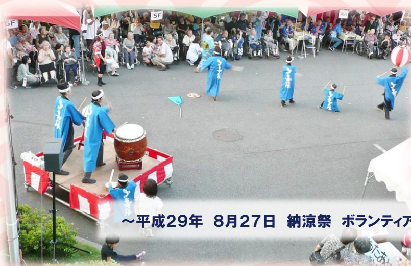
～平成29年 8月27日 納涼祭 ボランティアによる演舞～

〒350-0064 川越市末広町1-2-1 TEL 049-227-0031 FAX 049-227-0032