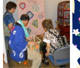
ストラックアウト!

天候にも恵まれ、大盛況でした。第1部はデイサービスで、屋内にて行い、職員によるダンス・三味線・盆踊りなどで盛り上がりました。第2部は入所・ショートステイで、ボランティアによる演舞・職員によるソーラン節・盆踊りなどで盛り上がり、最後は花火で締めくくりました。