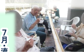
7月・流しそうめん

毎年恒例の、春から夏にかけての季節の行事です。爽やかな過ごしやすい時期に気分転換にお出かけをし、暑くなり始めた頃にひんやりとしたそうめんを召し上がりました。どちらも毎年大好評を頂いております。