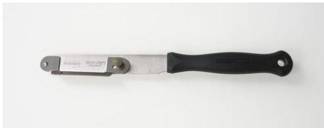
問い合わせ・注文No T-007