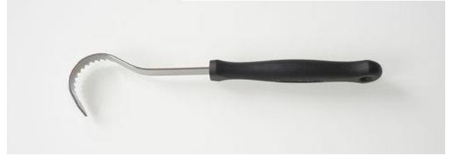
問い合わせ・注文No T-002