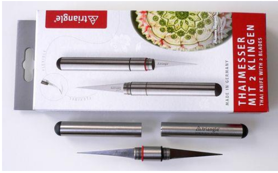
問い合わせ・注文No T-033 26661 タイmesser ステンレス (H & F) ¥ 9,800 全長170mm (刃45・50)