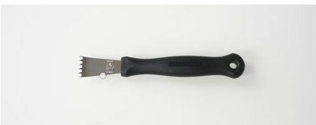
問い合わせ・注文No T-0111