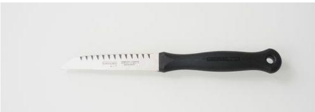
問い合わせ・注文No T-005