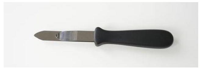
問い合わせ・注文No T-006