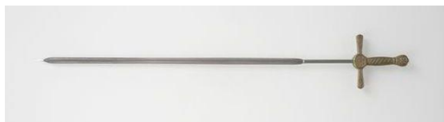
問い合わせ・注文No T-043 51313-27 ハーブキュー串 (十字) ¥ 2,000