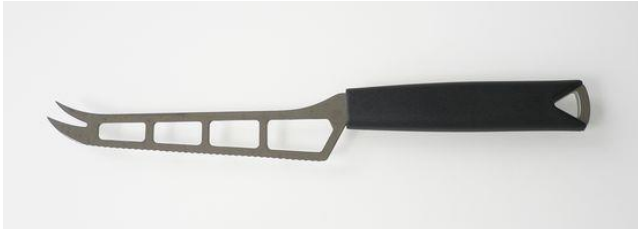
問い合わせ・注文No T-001