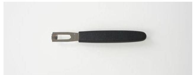
問い合わせ・注文No T-012