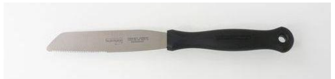
問い合わせ・注文No T-040 20189-10 ブレックファーストナイフ ¥ 2,400