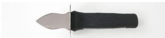
問い合わせ・注文No T-041 54202-00 オイスターナイフ ¥ 3,300