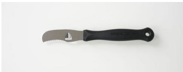
問い合わせ・注文No T-009