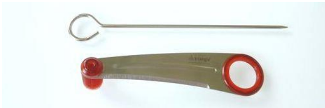
問い合わせ・注文No T-031