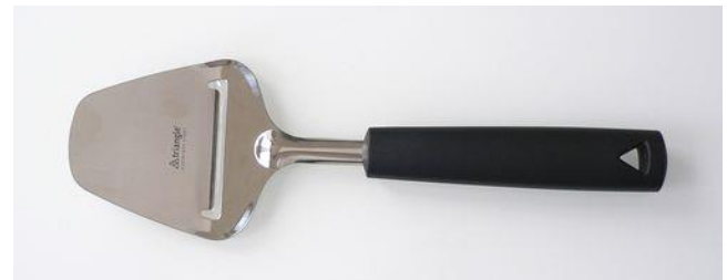
問い合わせ・注文No T-008