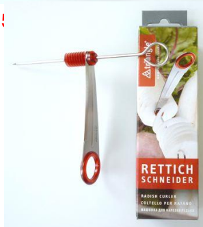
50430-00 ラディッシュカーラー ¥ 1,800 大根・ニンジンなどを 螺旋状に切る道具です。