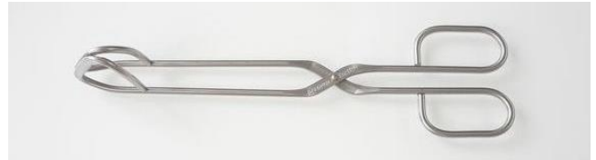
問い合わせ・注文No T-044 50470-24 キッチンング (24cm) ¥ 1,600