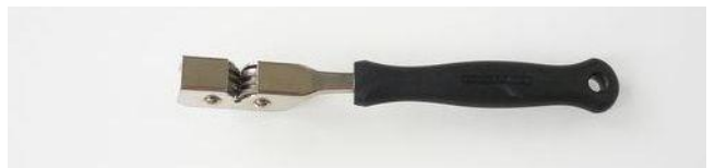
問い合わせ・注文No T-042 2145-06 シャープナー ¥ 1,400