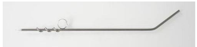
問い合わせ・注文No T-038 50435-00 ポテトスパイラル ¥ 1,000