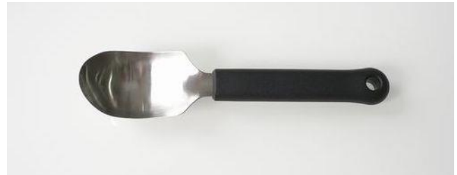
問い合わせ・注文No T-010