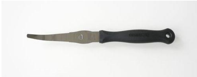
問い合わせ・注文No T-003