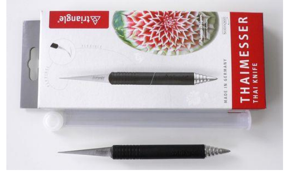
問い合わせ・注文No T-034 26662-50 タイmesser マーカーペン付き ¥ 6,000 全長158mm (刃50)