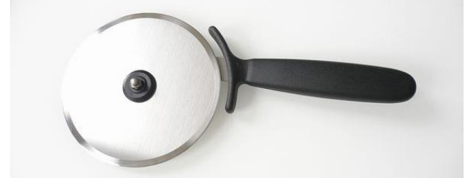
問い合わせ・注文No T-004