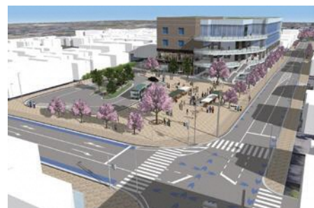
現在検討中の駅前イメージ

今後、道路拡幅に合わせて歩道を広げ、地域の魅力である桜並木の再整備、無電柱化などにより、快適な道路づくりを進めます。