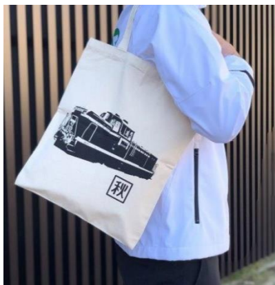
【ディーゼル機関車 DE10-1647】