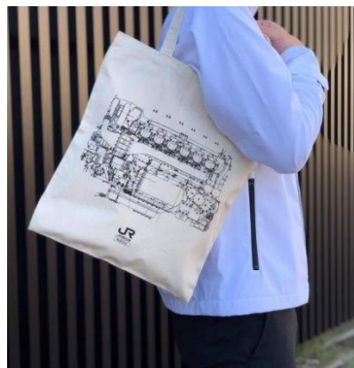
【ディーゼルエンジンの図面】