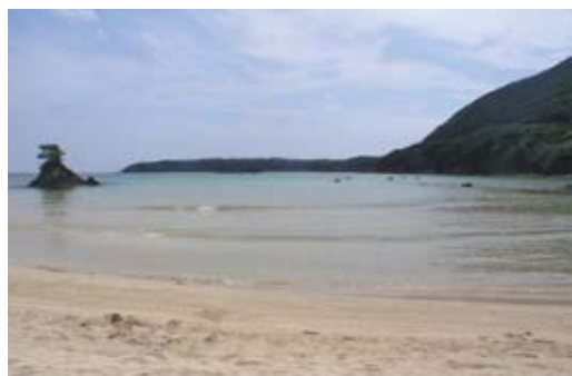
▲三宇田浜(対馬市上対馬町三宇田)

対馬は断崖絶壁がそのまま海に沈みこむ急峻な地形が多いが、シャワーやトイレが整備された天然・人工の砂浜も数ヶ所あり、海水浴場として整備されている。混雑する都会の海水浴場とは異なり、解放感たっぷりの美しい海辺を、プライベートビーチ状態で独占できる。