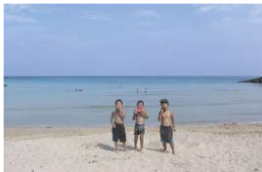
▲茂木浜(対馬市上対馬町茂木)