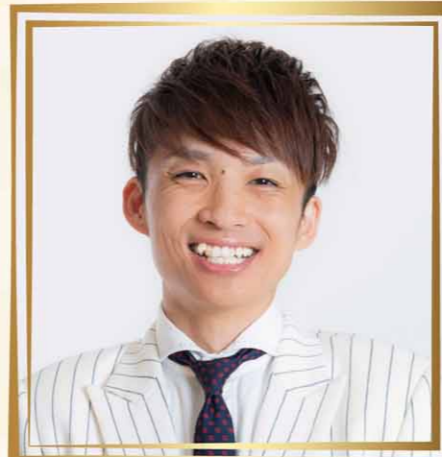
アインシュタイン 河井ゆずる