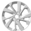
7.0J x 17" Lieti ratlankiai 225/60 R17