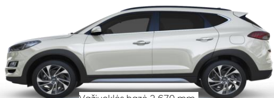
Važiuklės bazė 2 670 mm