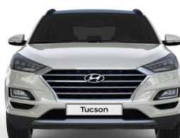
Plotis 1 850 mm