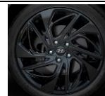
7.5J x 19" Lieti ratlankiai 245/45 R19