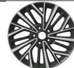
7.0J x 18" Lieti ratlankiai 225/55 R18