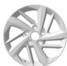
6.5J x 16" Lieti ratlankiai 215/70 R16