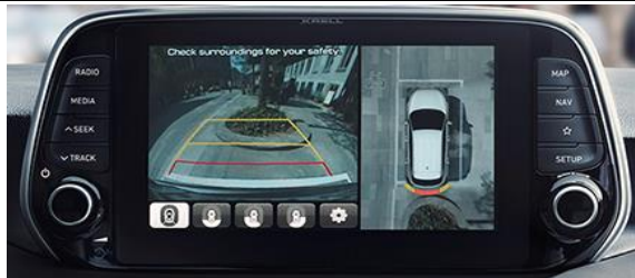
Informacijos ir pramogų sistema