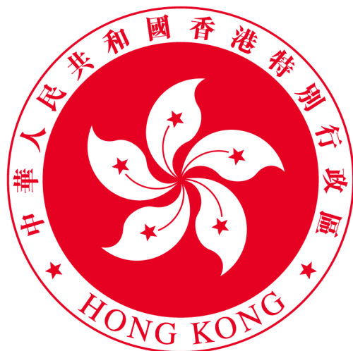
香港特別行政區區徽圖案