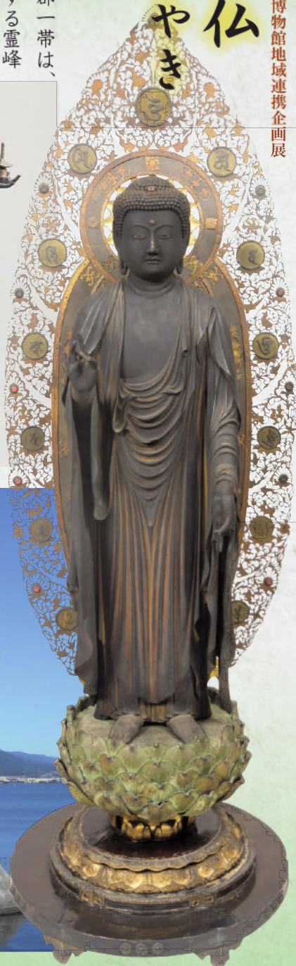
重文 阿彌陀如来立像 観音寺(草津市)