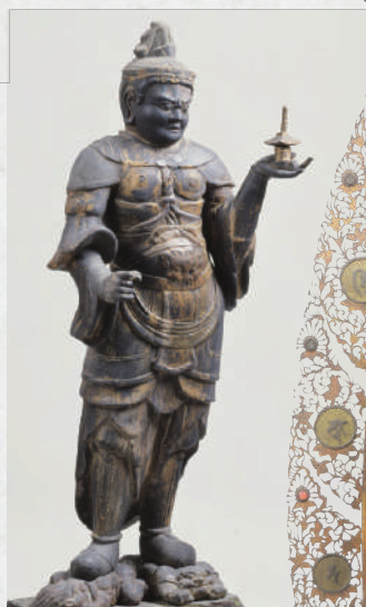
重文 毘沙門天立像 西遊寺(草津市)