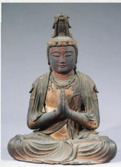
県指定 普賢菩薩坐像 志那神社(草津市)