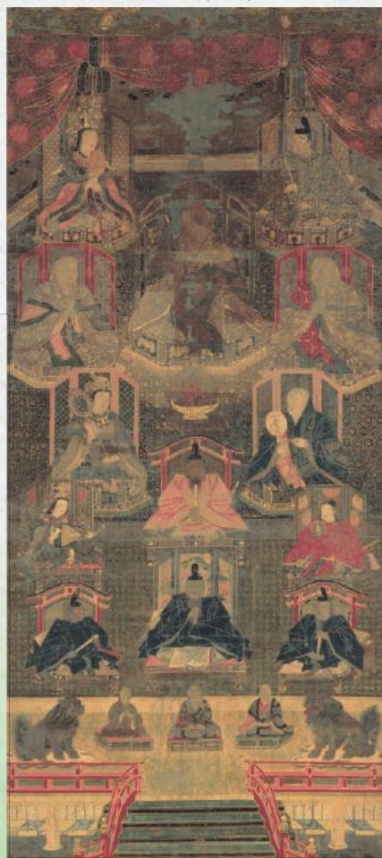
重文 日吉山王曼荼羅図 浄厳院(近江八幡市)