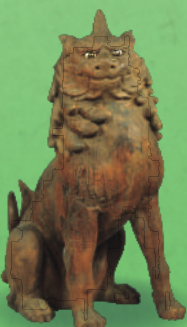
県指定 狛犬 大宝神社(栗東市)

新型コロナウイルス感染予防、拡大防止のため会期の変更等を行う場合があります。最新の情報はホームページ等をご確認ください。