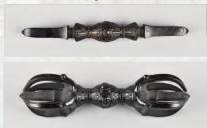
市指定 独鉾杵・五鉾杵 金勝寺(栗東市)

栗東を中心とした旧栗太郡 くりた 一带は、背後に金勝寺 こんしょうじ や不動寺 ふどうじ を擁する霊峰 こんせ 金勝山 たなかみやま と田上山 たのうえ がひかえ、琵琶湖方面には中世以降絶大な勢力を誇った観音寺が所在する平野が広がり、西には文化物流の大動脈であった瀬田川が流れます。そのような地域性から早くから仏教文化が花開き、古代には国家の影響力を背景に金勝寺が建立され、中世には琵琶湖の水運を一手に担った観音寺が栄えました。さらに、古代より都にまでその名が聞こえた式内社である小槻大社 おつくだいしや をはじめ、大宝神社 たいほうじんしや 、志那神社 しなじんしや など、重要な神宝を数多く今に伝える神社ものこります。栗太郡は全域が神仏あふれる聖地と言えるでしょう。