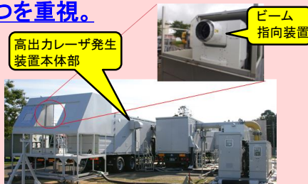
高出力エネルギー技術への取組の例