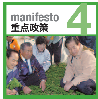
グリーンマニフェスト

「生活を守り抜く」。 それは今日を支えるだけでなく、将来の生活まで見通して政策を実現すること。 公明党は、環境対策や農業政策などで「緑の産業革命」を推進しながら、 経済を活性化し、雇用を生み出します。 世界をリードする「環境先進国・日本」を目指し、 低炭素社会の実現に力をつくします。