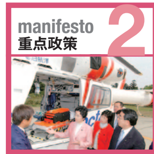
命のマニフェスト

「生活を守り抜く」。 それは医療や介護に不安のない暮らしを実現すること。 政治の最優先の仕事です。 命の大切さを第一に、女性や子ども、 高齢者や障がい者が安心できる社会に向けて、 生活を守り抜く公明党は、 医療政策・介護政策の充実に取り組みます。