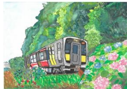
【高学年の部 金賞作品（2019年度）】