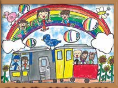
みんなだいすきすいぐんせん