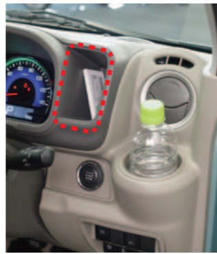
設於新推出改款儀錶板旁的小物置物箱，可放置鑰匙與薄荷糖等小物，便於立即取出。

水嶋說：「我認為正因為有各種限制，才更要下許多工夫，這就是輕型車。」面對任何挑戰困難並克服它們的結果，使得輕型車為越來越多人所接受，我們的眼光無法離開持續進化中的日本小型汽車。