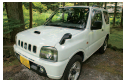
全長 3395 毫米 全寬 1475 毫米 全高 1680 毫米 車重 980 公斤 最小迴轉半徑 4.8 公尺