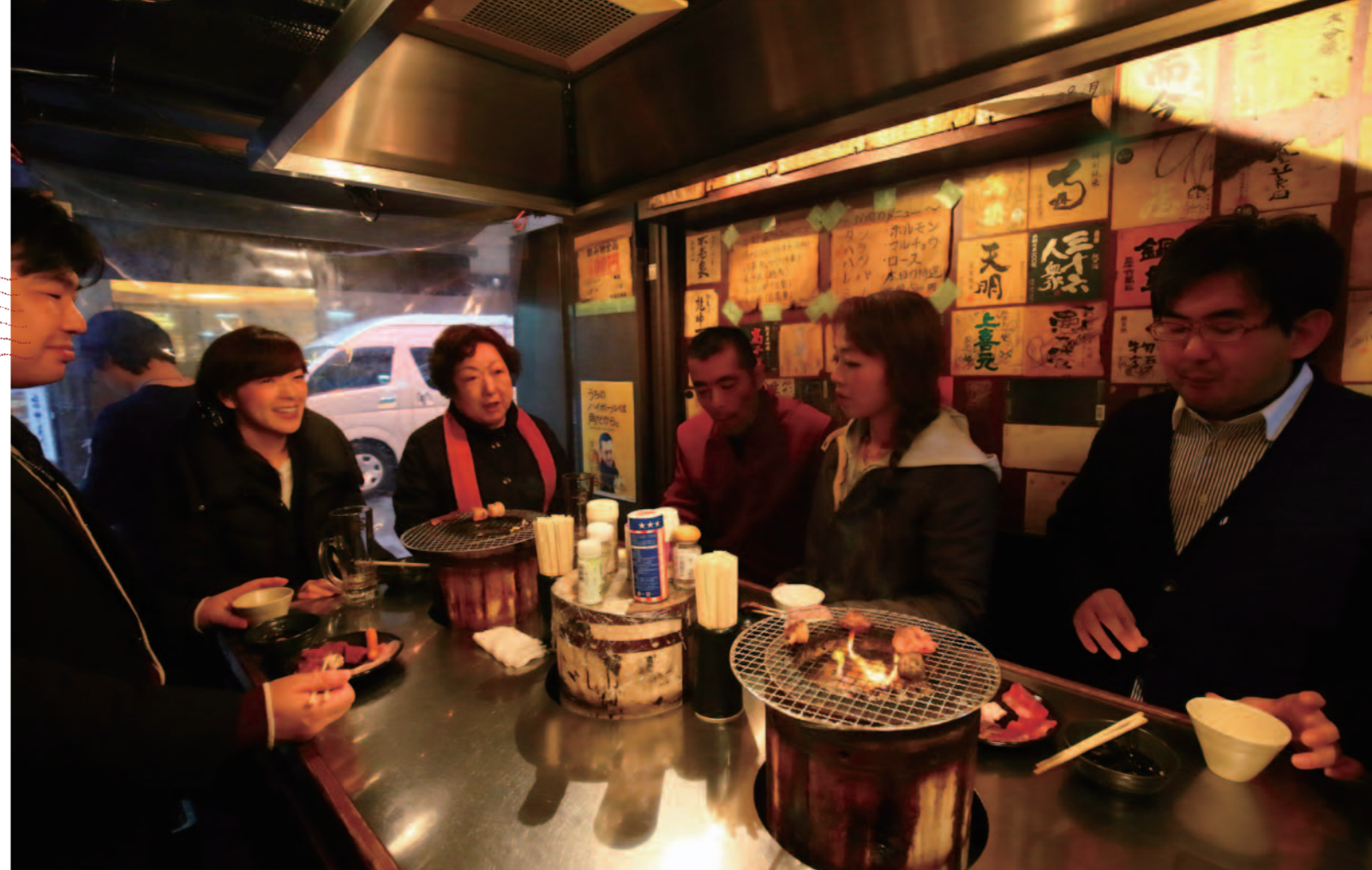
不認識的人互相烤肉、 氣氛和樂的時刻

「六花界」所用的肉均為當下最美味的肉品，除了特定部位之外的肉質等級都到達了 A5 或 A4 (A 為最高良率等級，5 則為最高肉質等級)，但一人份鮮肉拼盤卻僅賣 1000 日圓，順帶一提，所有清酒也以一杯 400 日圓提供，相當平