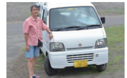
全長 3395 毫米 全寬 1475 毫米 全高 1815 毫米 車重 970 公斤 最小迴轉半徑 4.5 公尺