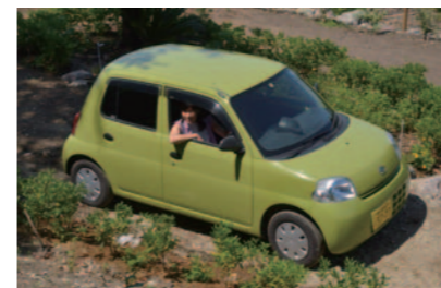
全長 3395 毫米 全寬 1475 毫米 全高 1470 毫米 車重 780 公斤 最小迴轉半徑 4.4 公尺 ※已停止生產與銷售