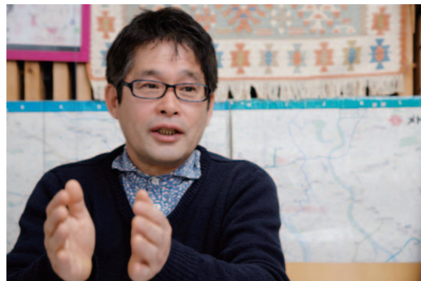
杉浦認為空間舒適感不僅在於房屋大小，與光線、風、溫度、味道、材質等各種因素密切相關。

到美術工藝建築研究所拜訪的委託人以30歲族群後半到40歲族群的夫婦居多，貸款額平均約為5500萬日圓，以這個價格要在市中心買下土地並建造房屋的話，土地面積就只能有10幾坪大小，杉浦所設計的狹小住宅其土地面積平均約為17坪，樓地板面積則約有27坪，建築平均一坪單價約在89萬日圓*左右，施工