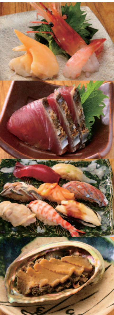
照片從上到下為牡丹蝦和青柳貝的生切片、鯉魚的生切片、自豪的握壽司、清蒸鮑魚。上餐順序裡除了這些之外還有遵從古早製法所做的豆腐、燒烤的料理等。