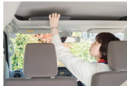
司機座上方的文件架，可收納 A4 資料夾與薄面紙盒，便於立即取出。