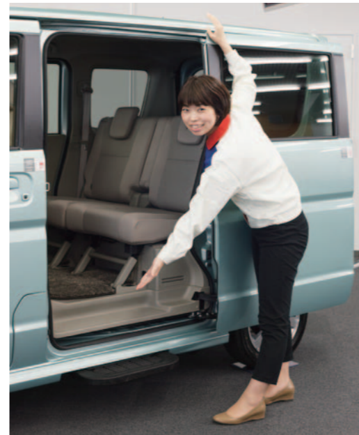
車身較高，無論上下皆輕鬆。腳下也寬敞，即使是成年男性乘坐時亦不會感到拘束。