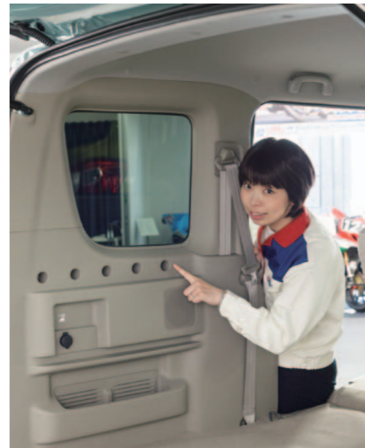
裝置支架與網子等配件用的開孔亦是標準配備，行李空間使用上很方便。