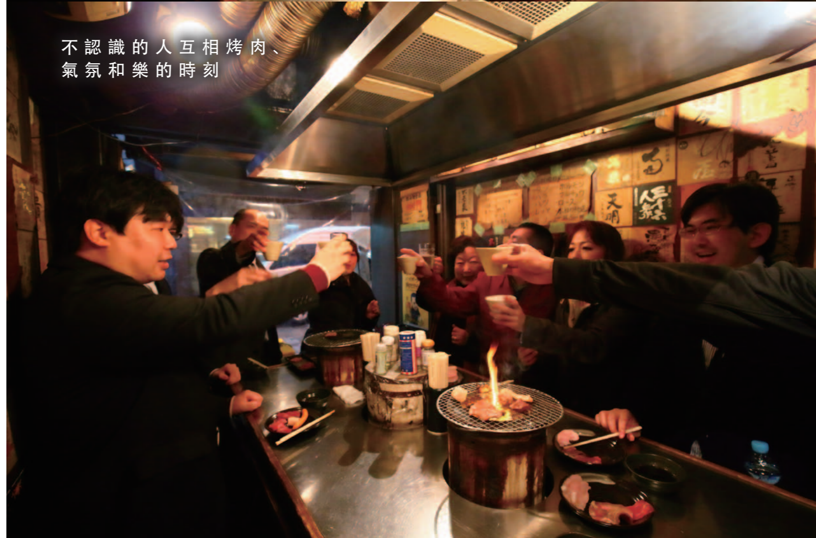
初次見面的人們一起愉快乾杯的瞬間開始變的友好。