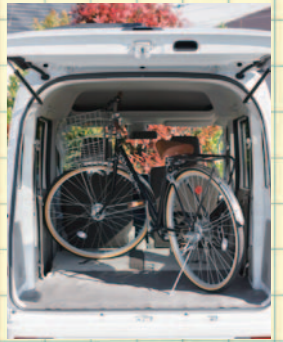
27 吋單車也不需橫放就可輕鬆地放入。

即使是輕型車，但當商務車使用時，可放置許多行李亦是相當重要的。因此，在開發 Every 改款車種時，相當注意它可裝進幾個紙箱，結果，實現它有可放置 69 箱橘子，或 40 箱啤酒，或 46 個小紙箱的行李空間。當停在較狹窄的道路，卸放行李時也不受妨礙的輕型車，與行李可謂是正是天生一對。