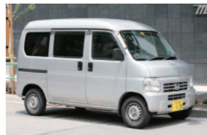
全長 3395 毫米 全寬 1475 毫米 全高 1880 毫米 車重 960 公斤 最小迴轉半徑 4.5 公尺