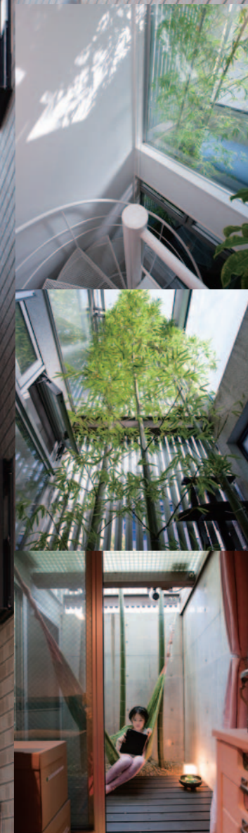
透過白色透明且輕巧的螺旋階梯，從窗 戶往半地下空間灑下和煦的陽光（上圖）， 以及生長在中庭的竹叢，中庭外牆使用百 葉窗設計，能夠從室外將光線照射入內， 卻不能從建築外部窺探到室內空間（中 圖），連接至小孩房的吊床空間是女兒最 喜歡的地方（下圖）。