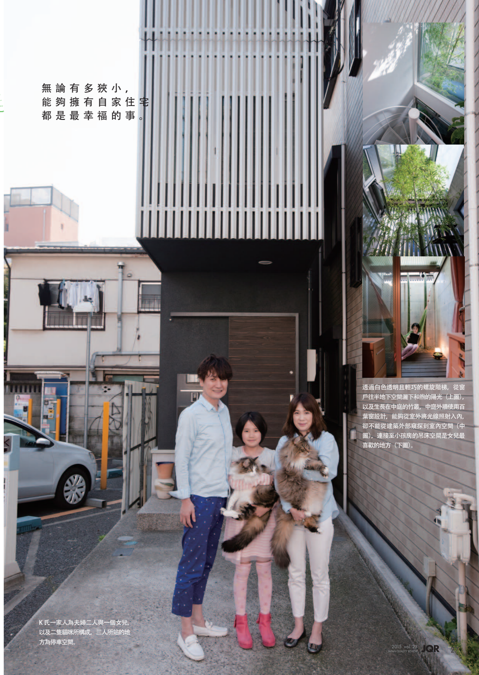
K 氏一家人為夫婦二人與一個女兒， 以及二隻貓咪所構成，三人所站的 地方為停車空間。