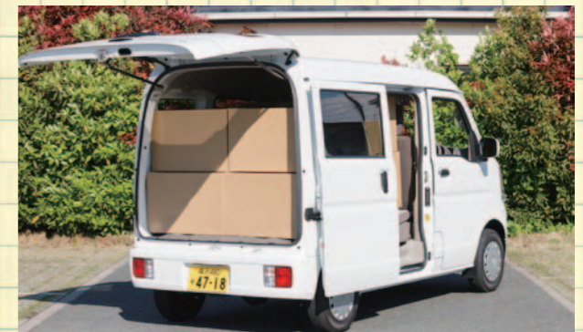
319×669×432 毫米中型紙箱可放入 17 箱，大件行李或地毯等長型物體也沒問題！