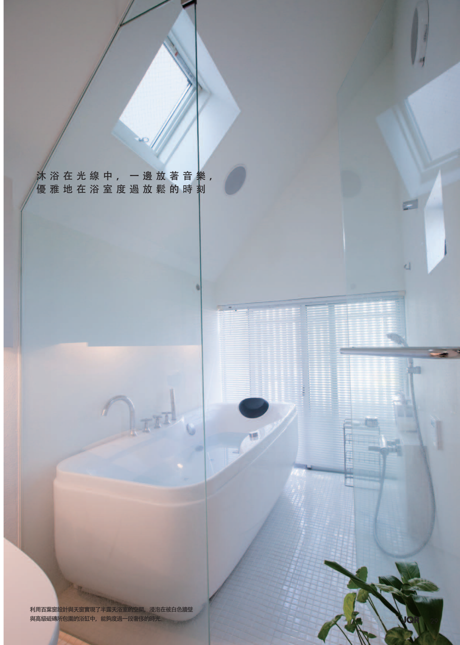
利用百葉窗設計與天窗實現了半露天浴室的空間，浸泡在被白色牆壁與高級磁磚所包圍的浴缸中，能夠度過一段奢侈的時光。