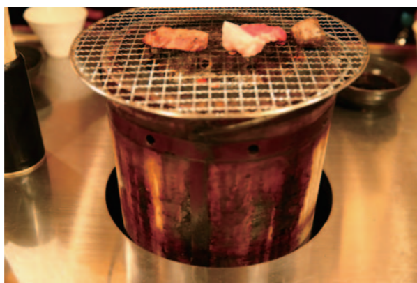
正因店內僅設有 2 座烤爐，為了不讓肉被烤焦以及不便之處，孕育出聚集的客人們之間的溝通交流。

可以平價享受到美味清酒和烤肉的「六花界」另一魅力，就是提供人與人互相交流的場所。進行採訪時，也能經常見到熟客為第一次來的客人教授如何將特定部位的肉烤得更加好吃的場景，森田說這在