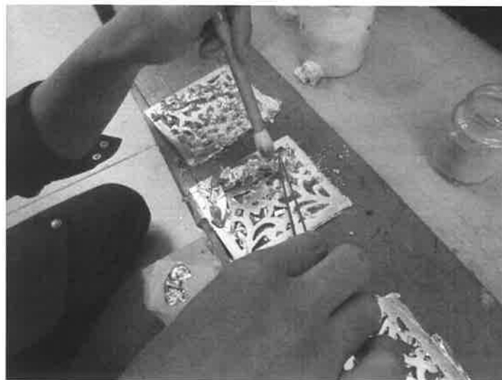
鋳金具技術研修の様子

また建造物の保存修理を適切な周期で行うためには、これらの技術の円滑な継承が必要となるが、一般建築における需要が少ないために、継続的かつ効果的な技術伝承が困難となっている。