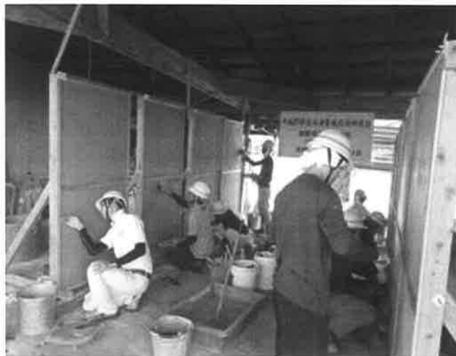
壁研修の様子（大津壁実技）

良質の日本壁を製作するためには、各種素材の吟味から施工まで高度な熟練が必要であり、文化財建造物修理においては、製作された壁の強度や美観が修理工事の良否に大きく影響する。しかし、日本壁製作のような湿式工法には十分な工期と熟練が必要であるため、近年の一般建築においては乾式工法が主流となっている。また湿式工法についても、モルタル下地の上に合成樹脂系資材で仕上げる工法などが一般化していることから、良質な日本壁を製作できる技術者が激減している。