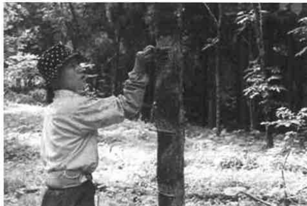
漆掻き研修の様子

日本産漆は透明度，接着力，堅牢度等に優れており，漆芸の制作や漆工品等の保存修理に不可欠の原材料である。漆生産に関する技術には，漆樹の植栽及びその保育・管理，成長した原木からの漆液の採取（漆掻き）等がある。なかでも，掻き鎌や掻き籠などを用いて，樹幹につけた傷から滲み出る生漆を採取する技術（漆掻き技術）は重要なものであり，漆樹を傷めず良質な漆を多く採取するには高度な技量が要求され，長年の経験を積んだ専門の技術者（漆掻き職人）によって行われているが，近年，技術者の減少及び高齢化が急速に進んでいる。