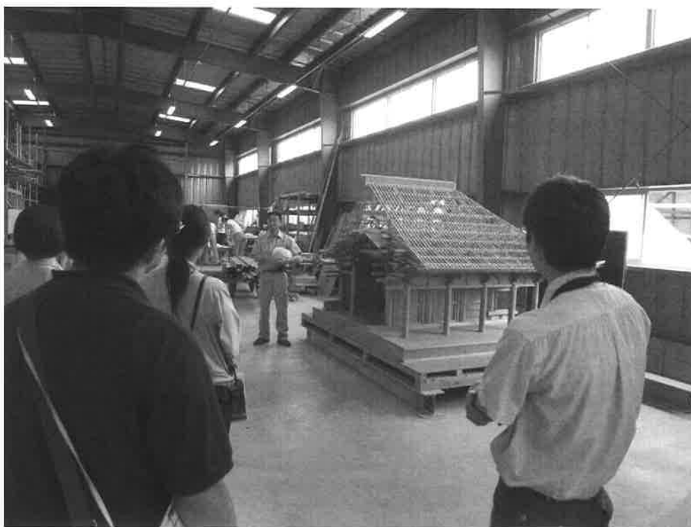
建造物修理中堅研修の様子

我が国における文化財建造物の保存修理は120年以上の伝統をもち、現在まで約2,200棟の建造物が根本修理を受けている。これらの建造物は7世紀から20世紀初頭まで約1300年にわたる各時代の遺構で、その種別は社寺、城郭、住宅、墓碑、橋梁 きょうりょう 等あらゆる分野にわたっており、構造も木造、石造、煉瓦造 れんがぞう 等多岐にわたり、また地域差や工匠の系統による差異もある。したがってその保存修理に当たる技術者には高度な専門知識に基づく技術が要求され、この修理技術は文化財建造物の保存には不可欠のものである。