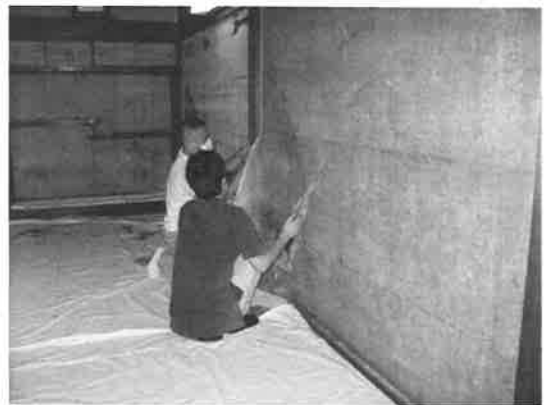
障壁画取り外し作業

我が国伝来の書画類は四季の温湿度変化の影響を受けやすい紙や絹を主材料とするものが多いため、原状のままに伝来するものは稀で、いずれも本紙を紙、糊によって補強した卷子、掛幅、屏風、折帖などの様々な表具の形態に仕立てられて伝わっている。換言すれば、これら文化財は紙、糊による裏打によってのみ本体の保存が図られているといっても過言ではない。それゆえ、こうした脆弱な文化財を後世に維持、保存していくためには、50年から100年を周期として、本紙を支える裏打紙の打替が必要となっている。これらの修理は、表具の解体、解装から旧裏打紙の除去、繕い、裏打替から表具仕立てへの工程を要するもので、各形態の文化財が容易に解体され、新たな生命によって甦ることが常に可能な状態にあるべきことが要求されるのである。この修理に当たっては、当然のこととして伝統的な技術に裏付けられた卓越した装演の技が必要不可欠となっている。