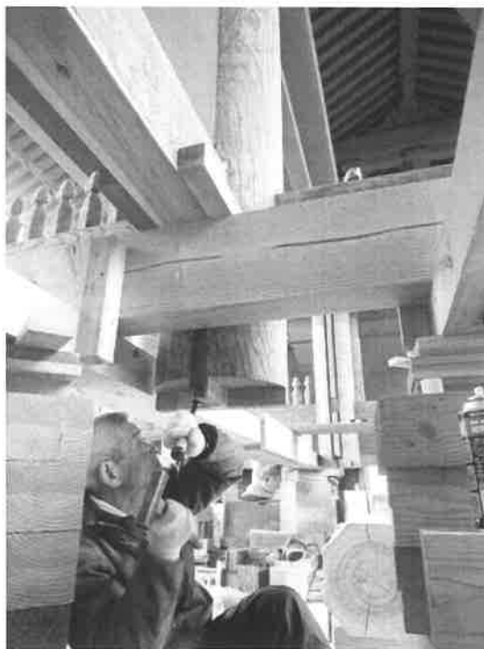
古式の木工技術による修理の様子

我が国の建造物は近年まで木造がその主流であり，したがって建築技術は木工技術によって代表され，それは世界に類例稀 まれ なほど精巧な成果を示すものである。しかし，近年では，材料，工具等の変化や，いわゆる近代建築の隆盛に伴って，古式の木工技術を体得する者は少なく，しだいに技術水準が低下しつつある。特に文化財建造物の保存修理に当たっては，各時代の木工技術の正確な踏襲，再現が求められるところから，現在数少ない木工技能者が体得している古式の木工技術を伝承し，錬磨してその水準を確保する必要がある。