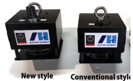
Note: photo shown pilot models may be modified without notice