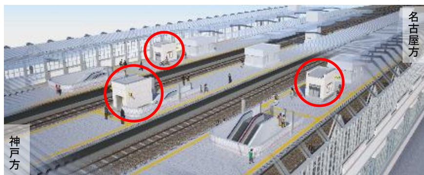
エレベーター整備イメージ (俯瞰図)