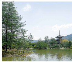
弊社豊岡工場 海浜大庭園