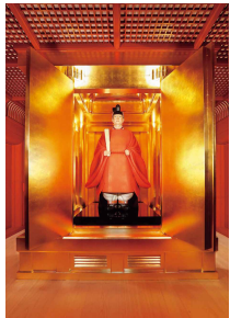
ご神体の徳仁皇太子等身大彩色木彫像 (東京芸大大学院 殿内佐司教授作)