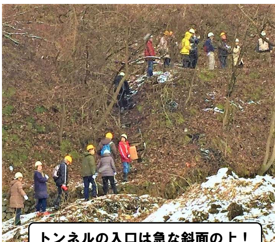
トンネルの入口は急な斜面の上！

26日は雪、そのなか、三菱重工業名古屋航空機の里山辺地下工場跡のフィールドワークがもたれた。名古屋への空襲の激化により、1945年、三菱重工名古屋航空機の疎開が松本市とその周辺地域にすすめられたが、さらに、里山辺に地下工場、中山に半地下工場建設がすすめられた。この里山辺・中山の地下工場・半地下工場建設を熊谷組が請負い、そこに数千人の朝鮮人が連行され、中山には、相模発電工事や富士飛行場工事の現場に連行されていた中国人も転送されてきた。