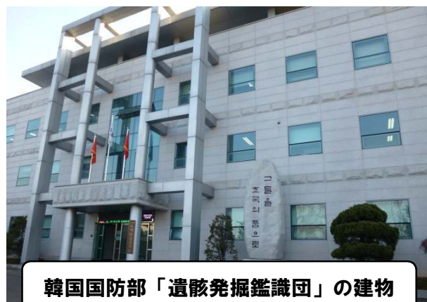
韓国国防部「遺骸発掘鑑識団」の建物

韓国では朝鮮戦争戦死者の遺族から集められた検体は3万人を超えます。それでも韓国において最大の問題は遺族の検体の「少なさ」だと指摘されています。高齢化する遺族に時間はないのです。DNAバンク（唾液を冷凍保存）と言う形でアジア太平洋地域の希望する遺族の検体保存を進めるなども検討するべきです。四肢骨（手足）の鑑定については、米韓の軍の研究所（アメリカDPAA／韓国遺骨発掘鑑識団）などでの