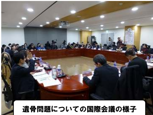
遺骨問題についての国際会議の様子