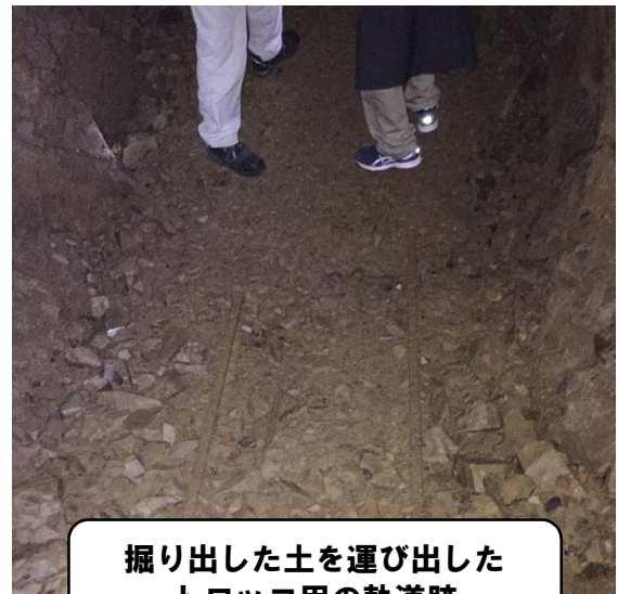
掘り出した土を運び出した トロッコ用の軌道跡

70年ほど前に掘られた壕や半地下工場跡地は、強制動員の時代の強制労働の状況を語り続ける遺跡である。松本市は戦争遺跡の記念碑を設置しているが、里山辺には平和宣言都市25周年にあたる2011年、陸軍飛行場跡地には2012年、中山には2013年に設置した。