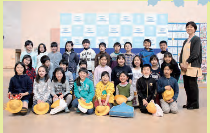
▲手作りおもちゃを児童センターへ寄付してくれた皆さん