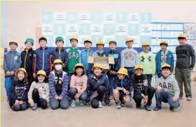
▲プルタブを寄付してくれた皆さん