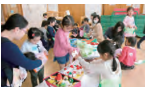
▲ケーキ屋さんは女の子に大人気!

児童センターの「みんなで遊ぼう」では、お店屋さんごっこだけでなく、さまざまな企画をしています。自由参加で、月～金曜日の10時半～11時に開催していますので、気軽に遊びに来てください。