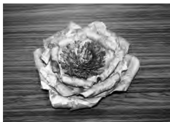
▲「てるてるぼうず」が新聞広告紙で作成した花のプローチ