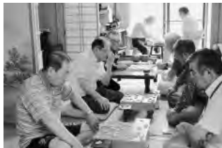
▲毎月第1・3火曜日喜楽会のみなさんが囲碁将棋を楽しんでいます