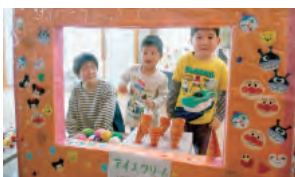
▲いらっしゃい!アイスはいかが?