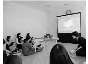
▲2月に行われた「にんじん」のママトーク