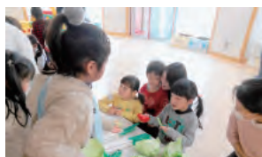
▲色紙のキャベツ、本物みたい!