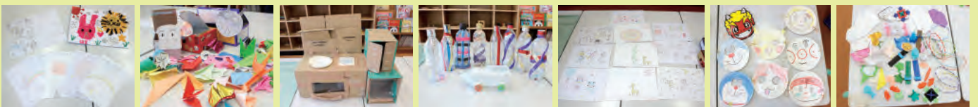
▲小学生たちが自分で考えて作った、児童センターの子どもたちのための手作りおもちゃ