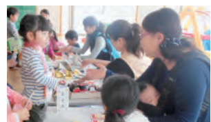
▲機種変更お願いしまーす!