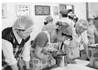
▲「酔芙蓉」でベテランママと若いママと一緒にクッキーづくりをしている様子