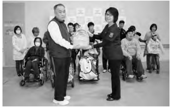
▲ねもと薬局様創立25周年記念として、障害者センターへAEDを寄付いただきました。