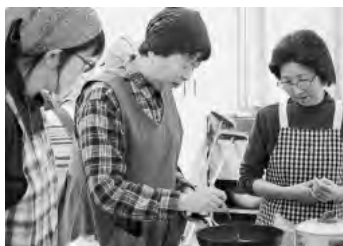
▲サロン交流会でのクレープづくり