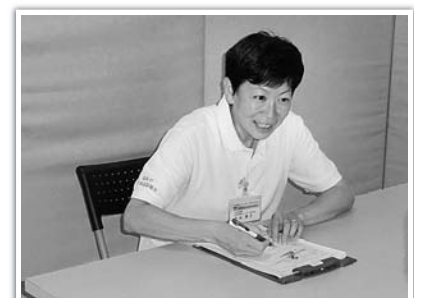
▲専門の相談員がお話を伺います