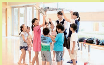
▲高校生と一緒にゲームを楽しむ元気っぱいの小学生