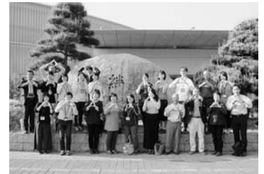
▲“まるっと”には、連携の“丸ごと”と、会議体である“サミット”の意味がかかっています