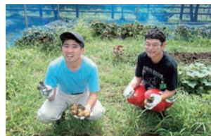
▲たくさん獲れたよ!