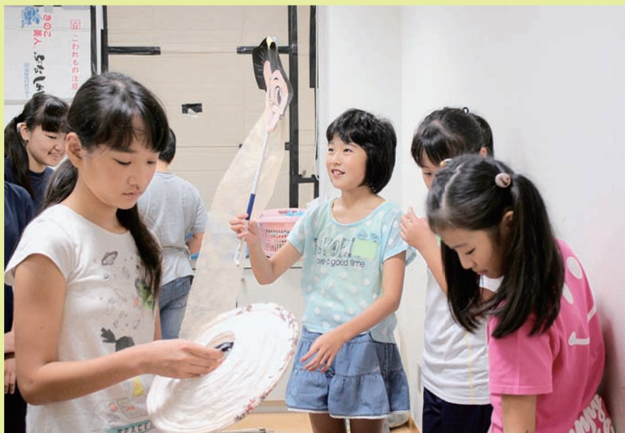
▲みんなで協力してお化け屋敷の準備をしました