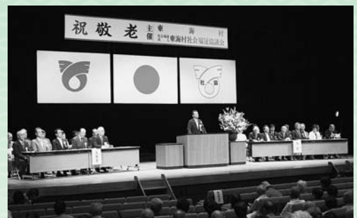
▲昨年度の式典の様子