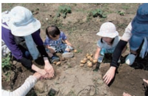
▲まだ出てくるかなー?

野菜が苦手な子どもも自分たちで育てたジャガイモは別物。特にカレーライスは大人気でおかわりして食べるほどでした。また、固形物が食べられない利用者もペースト状にすることでみんなと同じようにジャガイモの味を楽しむことができ、笑顔で食べる様子も見られました。