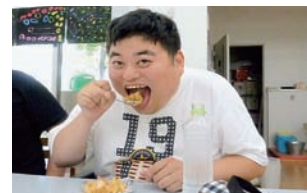
▲大きなお口でパクリ!