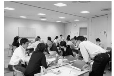
▲グループワークでアイデアを出し合います