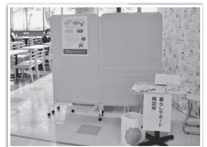
▲受付でお声かけください