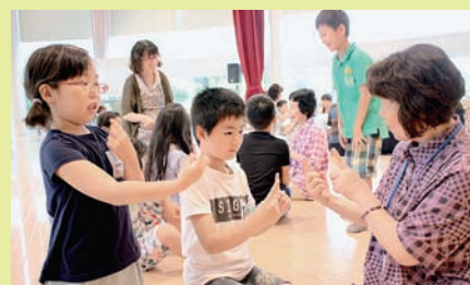
▲手話教室で指文字を教えてもらったよ