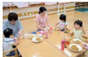
▲ジャガイモたっぷりのカレーライス!