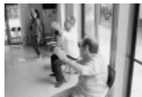
▲座ったままでも参加できます