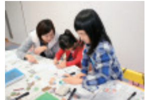
▲昨年度の年賀状づくりの様子