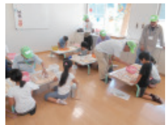
▲シリティアではボランティアの指導のもと、ゲームを楽しんでいました。