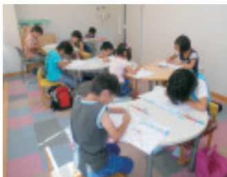
▲ドリル教室の様子。みんな集中して勉強に取り組んでいます。

エンジョイサマースクール開催中は、児童センター内の各講座と設定保育がお休みとなりますが、通常の利用は可能です。エンジョイサマースクールに申込んだ小学生も、そうでない皆さまも、夏休みを利用して遊びに来てくださいね。