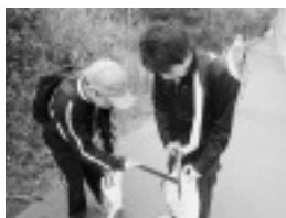
▲協力してごみを集める利用者