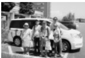
▲お気に入りの新車両で活動開始!

これからも障害者センターでは、利用者が「できること」を模索しつつ、地域の人との交流が生まれるよう、この活動を続けていきます。