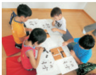
▲囲碁教室では真剣なまなざしで碁盤を見つめる姿が印象的でした。