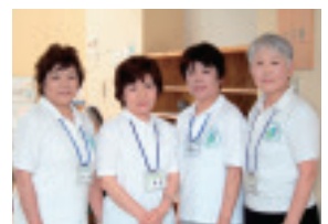
▲皆さんの参加をお待ちしています!

健康づくりができる憩いの場として、素晴らしい施設です。体操の効果が分かってくると、何度でも足を運びたくなります。お風呂に入った後に、まず体操を体験しに来てみてください!