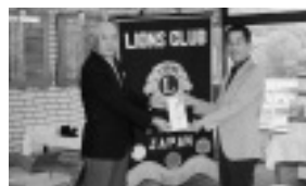
▲ライオンズクラブ様より50,000円をご寄附いただきました。