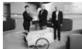
▲常陽ボランティア倶楽部様よりリヤカーをご寄附いただきました。