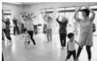
▲いろいろな世代の人と一緒に楽しめました

“であい”の利用者と地域住民の方との交流になり、同時に“であい”がこういった場所であるのかを、地域の方に知ってもらうことができました。