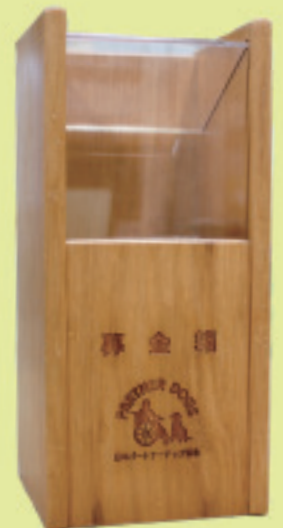
▲4人が募金した「絆」の正面窓口にある日本パートナーズ協会の募金箱