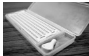
▲講座で使う点字作成用の定規

【申込み・問い合わせ】 地域福祉推進係 (ボランティア市民活動センター「えがお」) ☎283-4538