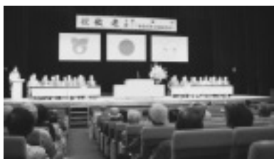
▲昨年度の敬老会。100歳以上の方は23人でした。

昨年までは、敬老祝賀会に出席された方には当日手渡し、欠席された方には後日お届けしていましたが、 今年度については、事前(9月中旬以降)に自宅や施設にお届けします。