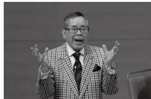
畑中良輔氏 (文化功労者、日本芸術院賞等受賞)

15 年 4 月に教育目標を策定するとともに校訓を定め、当時は中等部が門司北高校敷地で高等部が門司高校敷地ということになっており、校名は「門司」を残した「門司学園」ということに決定した。校歌の作詞に当たっては入念な推敲を行い、平成 5 年の門司高校創立 70 周年記念コンサート以来お付き合いをして頂いている畑中良輔先生に、電話と書簡で作曲をお願いしたところ、「ああ、いいよ」と引き受けてくださった。約 1 ヶ月後の 9 月、「出来たから、楽譜を送ります。」というお電話があり、更に、「この曲は、私が創立 60 周年で作曲した門司高校『逍遙歌』を受け継ぐものです。是非、門司中学・門司高校の良い伝統を継承して下さい。」と言われた。バリトン歌手であり、自らも素晴らしい歌曲を多く作曲している畑中先生らしいハ長調の明るく伸びやかな旋律で、一般の校歌とは異なり、歌曲のような校歌である。現在、門司学園の HP で流れているので是非一度聴いてみて頂きたい。なお、その後何度か畑中先生にはお会いしたが、「僕の作った校歌は、いつになったら甲子園で流れるのかな?」と言われたことも印象深く憶えている。当初は全く考えなかったが、野球部が 3 年前の秋の九州大会で活躍し、センバツの 21 世紀枠に選ばれながら補欠になったことが残念でならない。近い将来、必ず実現すると信じている。