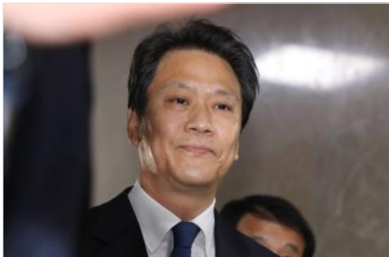
탁현민 "임중석, 불출마 고민 알고 있었다...양정철과 상의 없었을 것"