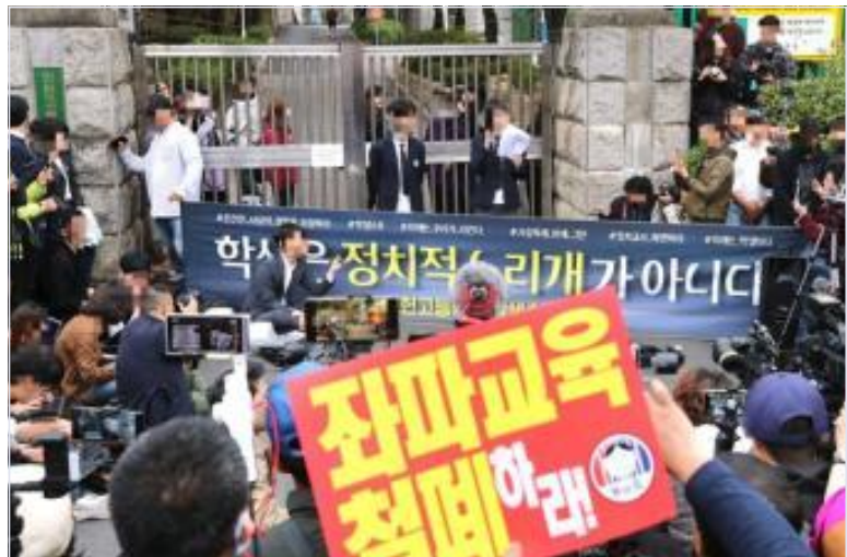
서울교육청 학생에 "일베나" 묻은 인허고 교사 추가 조사