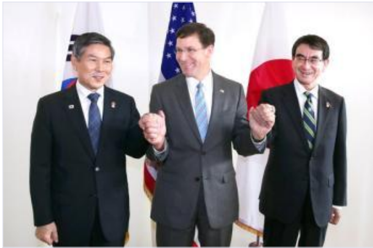
"일 변화 우선" 일관된 靑, 여론 업고 지소미아 종료 가시화