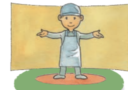
映像シアター&職人による解説

シアター映像にはうなぎパイのキャラクター「うなくん」が、うなぎパイの知られざる秘密の世界へご案内します。また、うなぎパイを実際で作っている職人が皆さまからの質問にお答えいたします。 ※シアターの上映時間は事前にご確認ください。