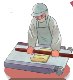
仕上・仕込の解説

職人によるうなぎパイ作りの行程を展示パネルで紹介。うなぎパイはひとつひとつ手作りしています。