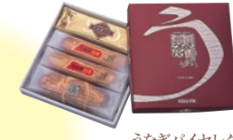
うなぎパイセレクト