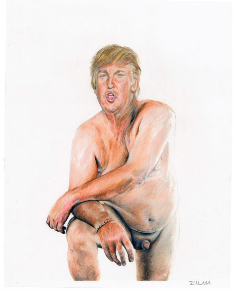
Illma Gore – Make America Great Again (2016)