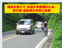
現在の小倉西舞鶴線(白鳥トンネル付近)

【事業効果】 ・慢性的な渋滞の改善 ・安心安全な道路空間の確保 ・舞鶴西IC、舞鶴東ICへのアクセス向上