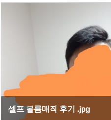
셀프 블룸매직 후기.jpg