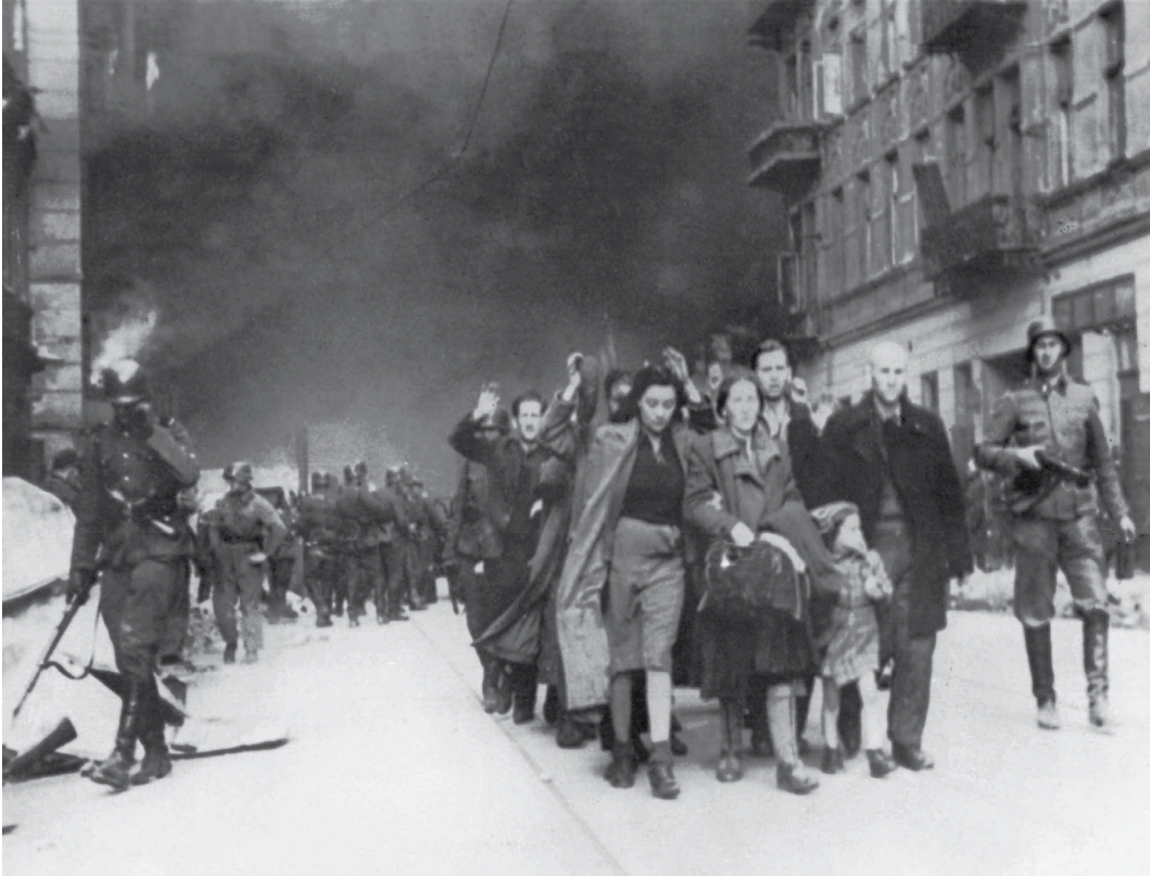
Ontruiming van het getto van Warschau, 1943

Ook op andere wijze kwamen Joden in verzet tegen de vervolging. Velen probeerden te vluchten, zich te verbergen of onder te duiken, met steun uit de bevolking. Anderen namen deel aan verzetsactiviteiten of sloten zich aan bij partizanen. Verzet en opstanden hadden echter vaak represailles tot gevolg. Bij deze vergeldingsacties werden in de regel veel onschuldige mensen door de Duitsers gedood. Dat waren 'gewone' burgers, maar ook Joden. Bij de Aktion Erntefest in november 1943 werden door SS-eenheden en politie in een paar dagen 42.000 Joden uit verschillende kampen doodgeschoten. Een deel van de voor arbeid geschikte Joden werd samengebracht in resterende concentratiekampen.