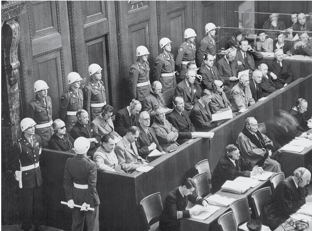
Neurenberg processen. Voorste rij: Goering, Hess, Von Ribbentrop, Keitel, Rosenberg, Frank, Frick, Streicher, Funk, Schacht. Achterste rij: Donitz, Raeder, Von Schirach, Sauckel, Jodl, Von Papen, Seyss-Inquart, Speer, Von Neurath en Fritsche