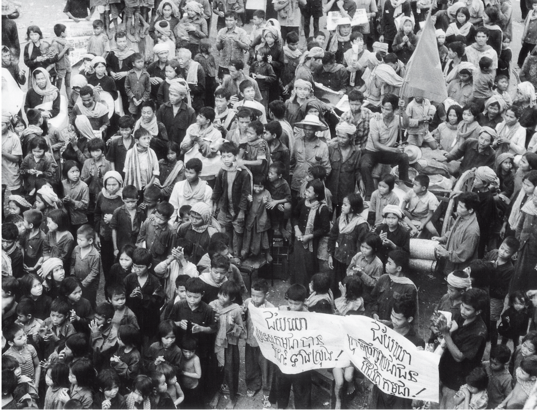
De Cambodjanen vieren de bevrijding, 17 januari 1979.