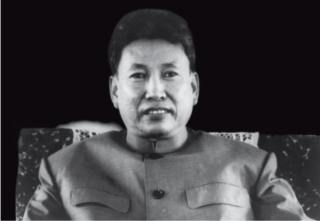
Pol Pot, 1978