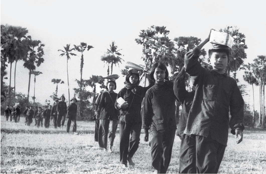
Kinderen werken tijdens het regime van Pol Pot.

vrouwen en jonge kinderen, 300 per groep. Eten, voornamelijk rijst en zout, werd bij elkaar gelegd en collectief uitgedeeld. [...] Begin 1977 werden er voor het eerst collectieve huwelijken gesloten. Honderden stellen en de meesten wilden niet. Alle persoonlijke eigendommen werden in beslag genomen. Er begon een nieuwe serie executies, uitgebreider dan in 1975 en gericht op mensen die het opgedragen werk niet konden of wilden uitvoeren. De voedselrantsoenen en kledingtoelagen werden kleiner. Velen stierven van de honger. Drie kledingsets per jaar werd de norm. Samenscholingen van meer dan twee personen waren verboden.'