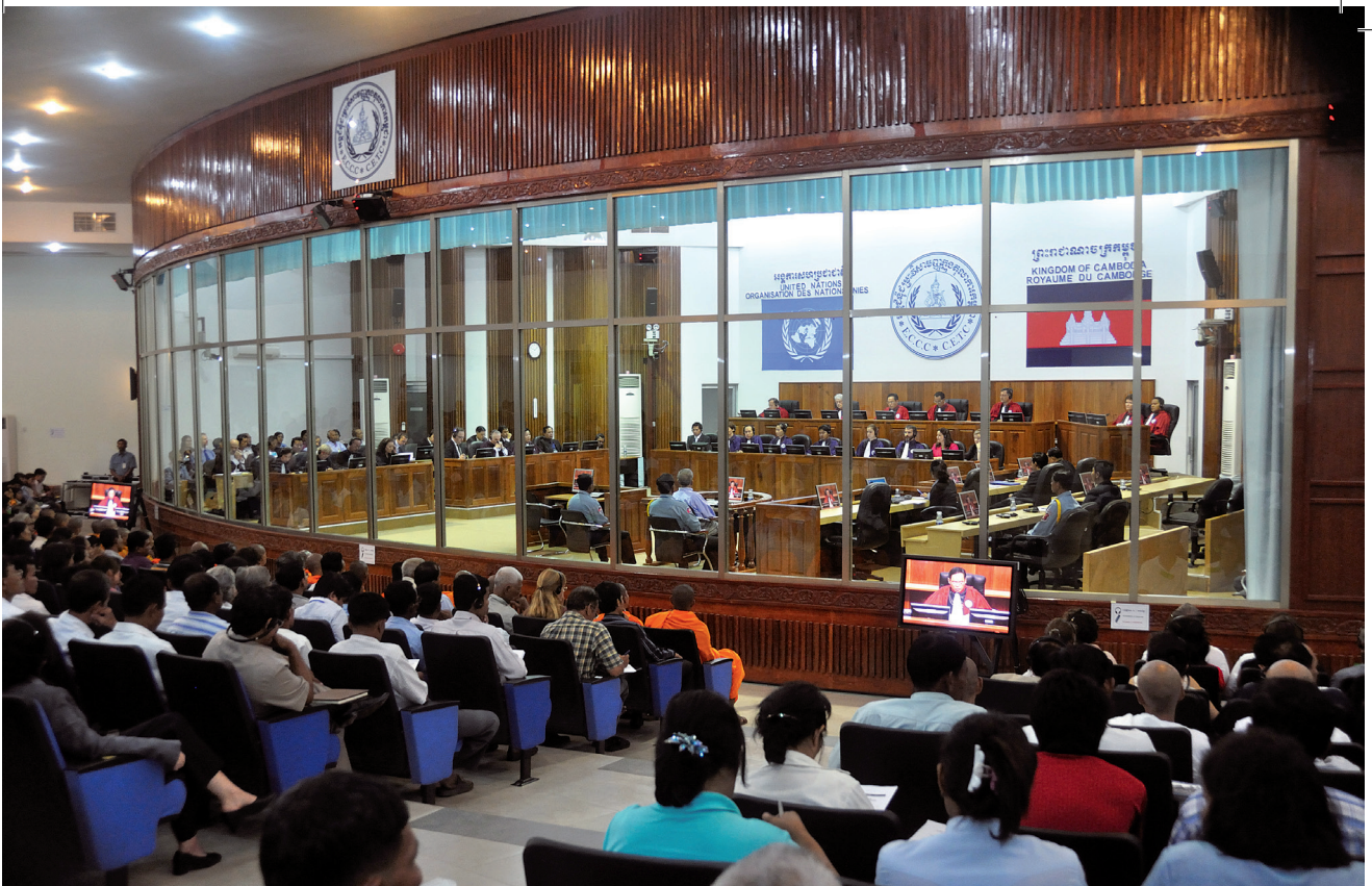
Rode Khmer-leider Duch wordt veroordeeld bij het Cambodja-tribunaal, 26 juli 2010.