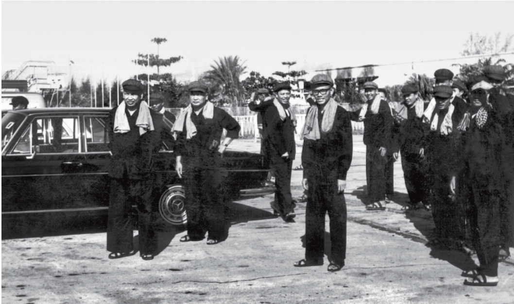
Leiders van Democratisch Kampuchea en leden van de Permanente Commissie van het Central Comité van het CPK

De leiders lieten weinig zien van hun persoonlijk leven. In 1978 werden voor het eerst journalisten tot DK toegelaten. Zij moesten de premier vragen: ‘Wie bent u, kameraad Pol Pot?’ 5 Hij heeft nooit toegegeven dat zijn echte naam Saloth Sar was. Als Cambodjaanse activist-student in Parijs in 1952 had hij een opvallend pseudoniem gekozen: de ‘Authentieke Cambodjaan’ ( khmaer da'em ). Zijn medestudenten verkozen minder raciaal getinte, modernere codenamen, zoals ‘Vrije Khmer’ of ‘Khmer-arbeider’.