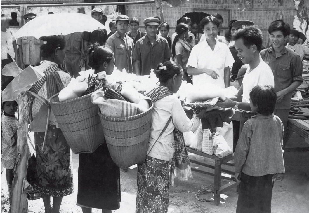
Mensen van etnische minderheidsgroepen verkopen stoffen op de markt.

de VS gesteunde regime van Lon Nol. Duizenden werden hierbij vermoord. Nog eens 100.000 werden door het regime van Pol Pot verdreven in het eerste jaar na de overwinning in 1975. Wie in Cambodja was achtergebleven, werd vermoord.