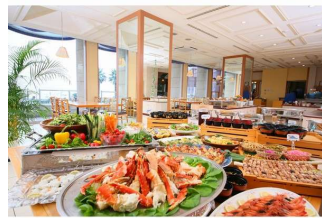
夏のバイキング会場