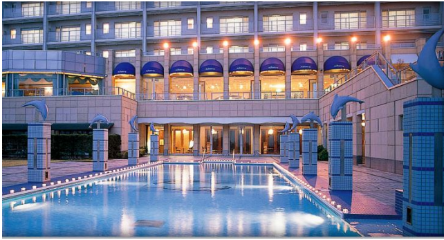
西伊豆一の南欧風リゾートホテルです☆