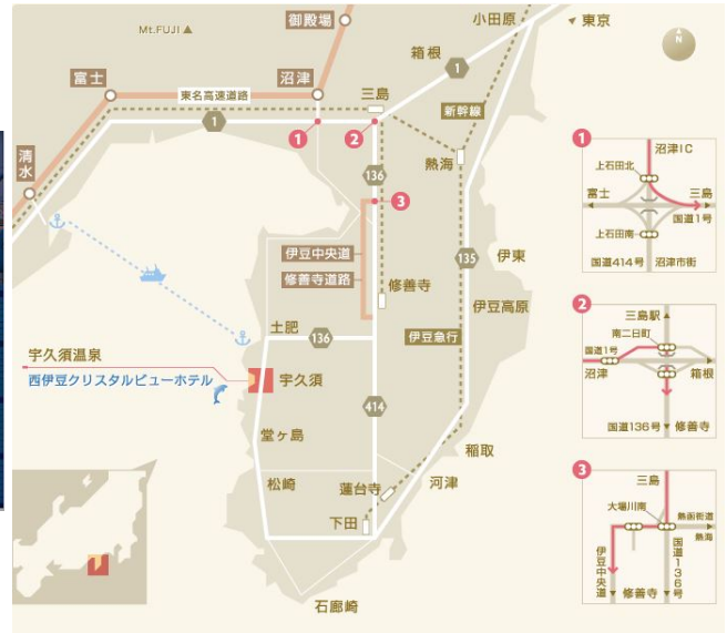
東京～修善寺駅 (125分) ～ホテル (バス70分)