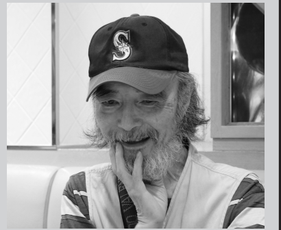
国際鉄道模型コンベンション会場内の特設ステージで行います。