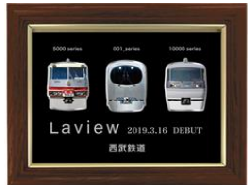
「Laview」デビュー記念フォトピンズ