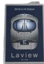
タッチアンドゴー