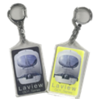
アクリルキーホルダー