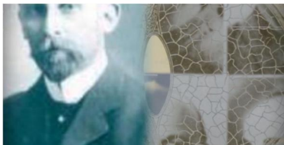
Brian Eno's The Ship-A Generative Film © Opal Limited 2016