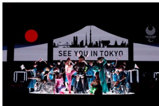
リオ2016パラリンピック競技大会閉会式 東京2020フラッグハンドオーバーセレモニー