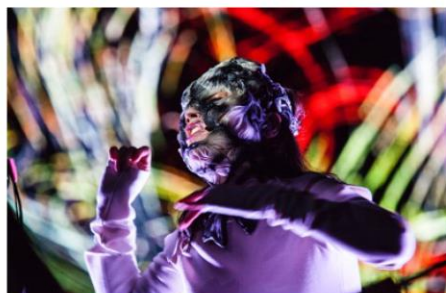
Making of Björk Digital