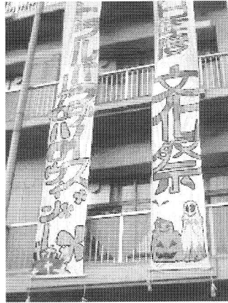
↑ 昨年度、垂れ幕の写真

2006年10月28日、中央高校にとって15回目となる文化祭が開催されました。 変わった響きのテーマは「中央を楽園に。南国の楽園で行われるハロウィンパーティー」をイメージして名付けられたそうです。「南国のハロウィン」に相応しく明るい色調にかぼちゃやお化けが描かれた門や垂れ幕(写真)が迎えてくれました。 舞台発表は太鼓部の力強い演奏で幕を開け、在校生たちのダンスや三味線・演劇・バンドなどで盛り上がり、各教室を使つての模擬店では焼きそばやチョコバナナの販売が人気を集めていました。