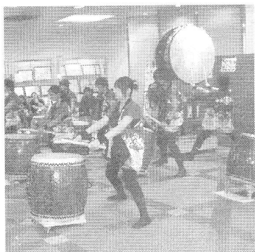
(写真) 文化祭での太鼓部の演奏

新しい校長のもとで教職員が一丸となつて、改革に取り組んでいくには、ぜひとも皆さんのご支援が必要です。新しい局面を迎える中央高校に皆さまの温かいご支援をお願いして、私の退任の挨拶とさせていただきます。