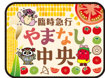
「やまなし中央」号ヘッドマーク