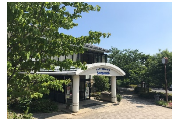
シルクふれんどりい