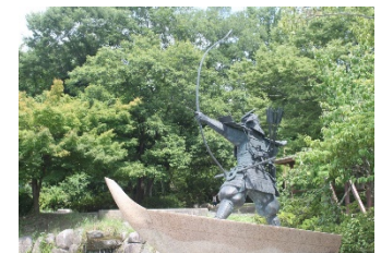
浅利与一の銅像 (シルクの里公園内)