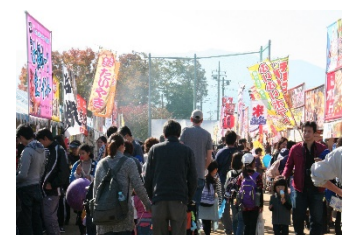
中央市ふるさとまつり

(中央市役所商工観光課内) TEL 055-274-8582 平日 8:30~17:15