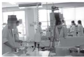
※酵素の蔵元では国立大学と醗酵酵素の共同研究が10年以上続いています。

「かすみ」ばやけ「ボ」酵素と代謝酵素が起因し「タボタ」等。加齢だけが原因ではなく、毛細血管の詰まりや減少により、繊細な目に必要な栄養が届かないためだが、これは放つてはならない。当然加齢で衰えた消化