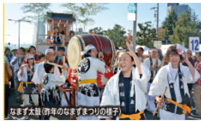
なます太鼓(昨年のなますまつりの様子)