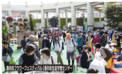
掛川市フラワーフェスティバル(掛川市生涯学習センター)