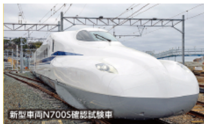
新型車両N700S確認試験車

～累計参加者500万人達成記念～ 浜松駅開業130周年と 新幹線の工場を 「なるほど、発見!」