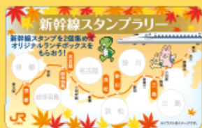
「新幹線スタンプカード」イメージ

※カード破損、紛失の場合は再発行いたしません。 ※お一人様1コースの参加で1枚限りです。 ※譲渡不可です。 ※デザインは変更する場合がございます。