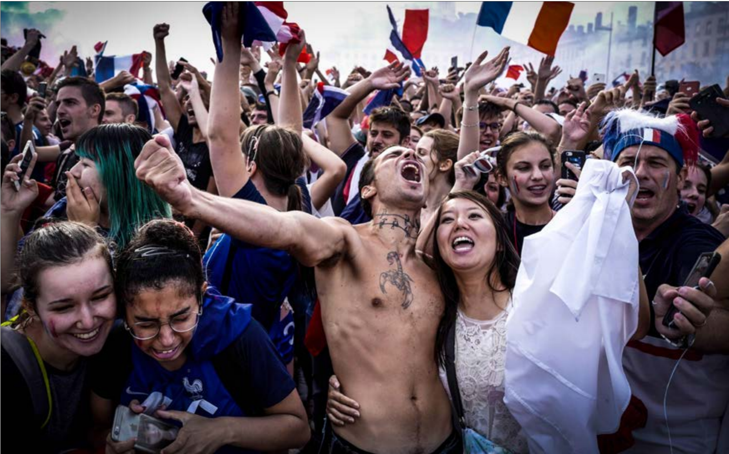
المشجعون نوعان، المشجعون المادحون والمحبوبون والتشغوفون (جان فليبا (جان فليبا) كسانزيك (أفرب)

«بعد جمعة من الاحتياح 1982، بلش المونديال، تصوّر بلدي عم يحتلوه، وأنا عم فكر بماتش، هيد اليوم بتذكروا كثير مئج: ماتش ايطاليا والبرازيل.