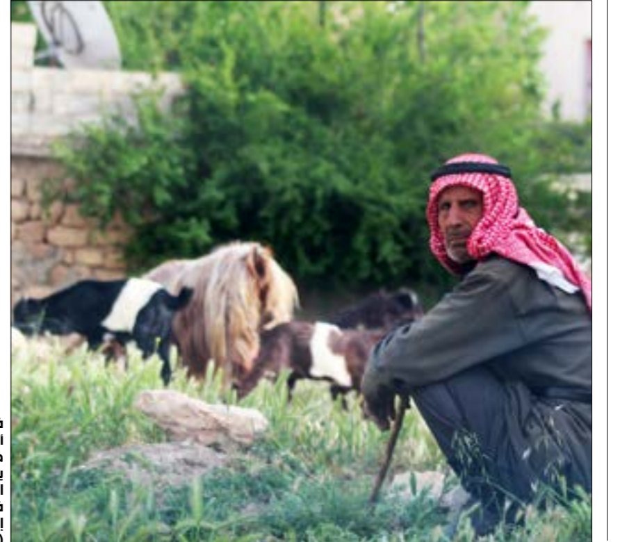
في منطقة بعلي أهليا الأرض التي مرتبة «العرض»، يؤدي الخلاف على التقسيمات العقارية في أحيان كثيرة إلى إسالة الدماء