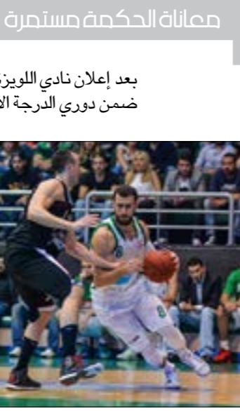
مماثلة الحكمة مستمرة

أما كخيا فعاد قبل نحو أسبوعين، ووجه كتاباً إلى وزارة الشباب والرياضة للتراجع عن استقالته التي تقدم بها من رئاسة الاتحاد وعضوية اللجنة الإدارية، ولكي يعود ويمارس مهامه في اتحاد كرة السلة، لكن اللجنة الإدارية للاتحاد عقدت جلسة استثنائية رفضت خلالها بإجماع الأعضاء الثمانية عودة كخيا عن استقالته، مذكراً بأنها كانت قد تمتعت عليه وعلى باقي الأعضاء المستقبليين العودة عن الاستقالة في وقت سابق ولكنهم لم يصغوا إليها. ورغم كل هذه التطورات، والتي تستمر منذ نحو عام وتعكس على الدوري المحلي والنقل التلفزيوني والإعلانات داخل الملعب، وحتى على المنتخب الوطني خلال استحقاق تصفيات كأس العام 2019، فإن المرجعيات في البلد لم تُعر أي اهتمام للموضوع كما في السابق، على قاعدة ليستقل من يريد ويبقى من يريد، الأهم أن تنتهي البطولة، كيف تنتهي في المكاتب أو على أرض الملعب لا يهم، أصلاً لم يعد هناك لعبة. حتى أن كل الخلافات وتراجع اللعبة إدارياً وفتحاً لا يحضر على طاولة أحد، وكان اللعبة باتت عبئاً على الجميع، بعد أن كانت في يوم من الأيام محط اهتمام الجميع، الذين كانوا يستفيدون منها مادياً خاصة خلال الفترة الذهبية مع الرئيس الراحل أنطوان شويري، ونهضة العالم المقررة في الصين عام 2019. استمرت المراوحة ولم يحصل أي اختراق في جدار الأزمة. جاء موعد بطولة دبي الدولية التي تشارك فيها أندية لبنانية. حينها حصل اتفاق يُعرف في الوسط الرياضي السلوي بـ «اتفاق دبي» بين كخيا ومناقسه على رئاسة اتحاد كرة السلة في انتخابات عام 2016 أكرم الحلبي الرئيس لجنة المنتخبات الوطنية المستقبل حالياً، يقضي بإسقاط اللجنة الإدارية عبر استقالة