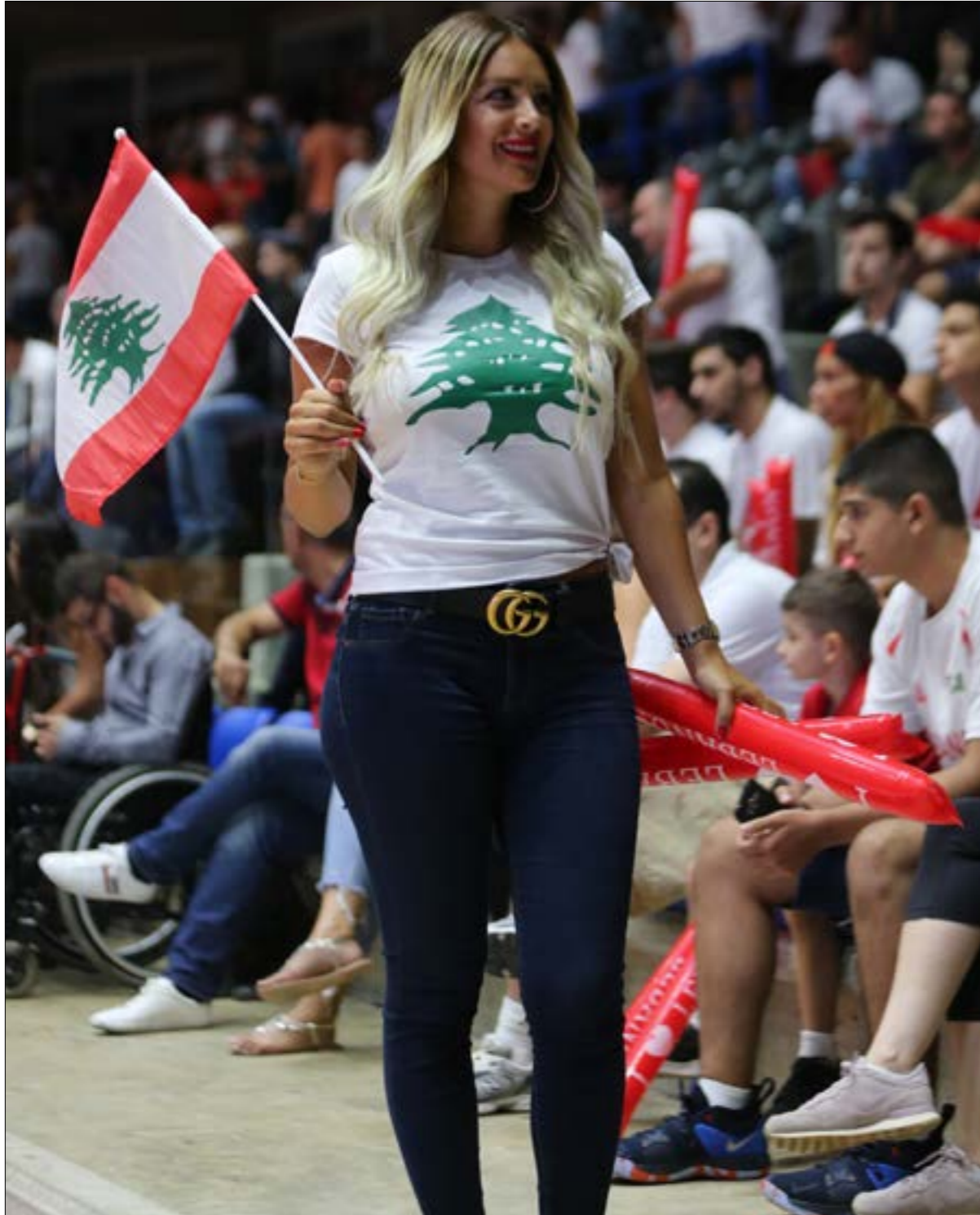
انكسرت الخلافات على منتخب لبنان خلال تصفيات كأس العالم (مروان بو حيدر)

عدم وجود غطاء سياسي يفاقم من حجم الخوف لدى البعض. وهذه نقطة مهمة في بلد كلبان، اللعبة تغرق بشكل سريع، ولا يبدو أن ممثلتي الأندية المحلية الناشطة في دوري الدرجة الأولى إلى