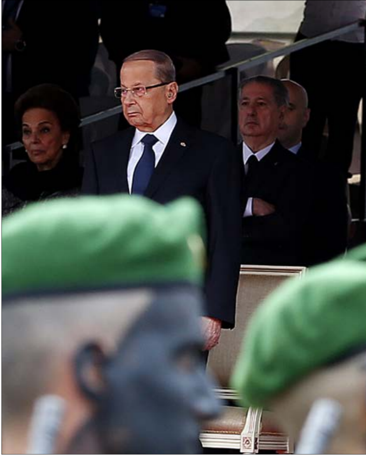
كان الحريري قد وعد عون بالتأجيل في موعوم التنسيق مع سوريا بعد الانتخابات (ميلان الموسوي)

ومع أن ممثلي الجهات الدولية حاولوا عرقلة العملية، إلا أن اللوافة وصلت بأحدهم إلى حدّ السؤال عن صلاحية حزب الله في إعلان برنامج لإعادة النازحين السوريين. وعندما سئل المسؤول الدولي عن سز احتجاجه، قال إن الأمور يجب أن تكون عبر الدولة اللبنانية، وليس عبر حزب معين، فقيل له: لماذا لا تبادرون إذا إلى حدّ الحكومة اللبنانية على القيام بهذه الخطوة بدل أن تقوم بها الجهات العابرة العور إلى الدول العربية الدولي نفسه ألا إلى جانب حزب الله، سيباشر التيار الوطني الحر والحزب السوري القومي الاجتماعي بتنظيم