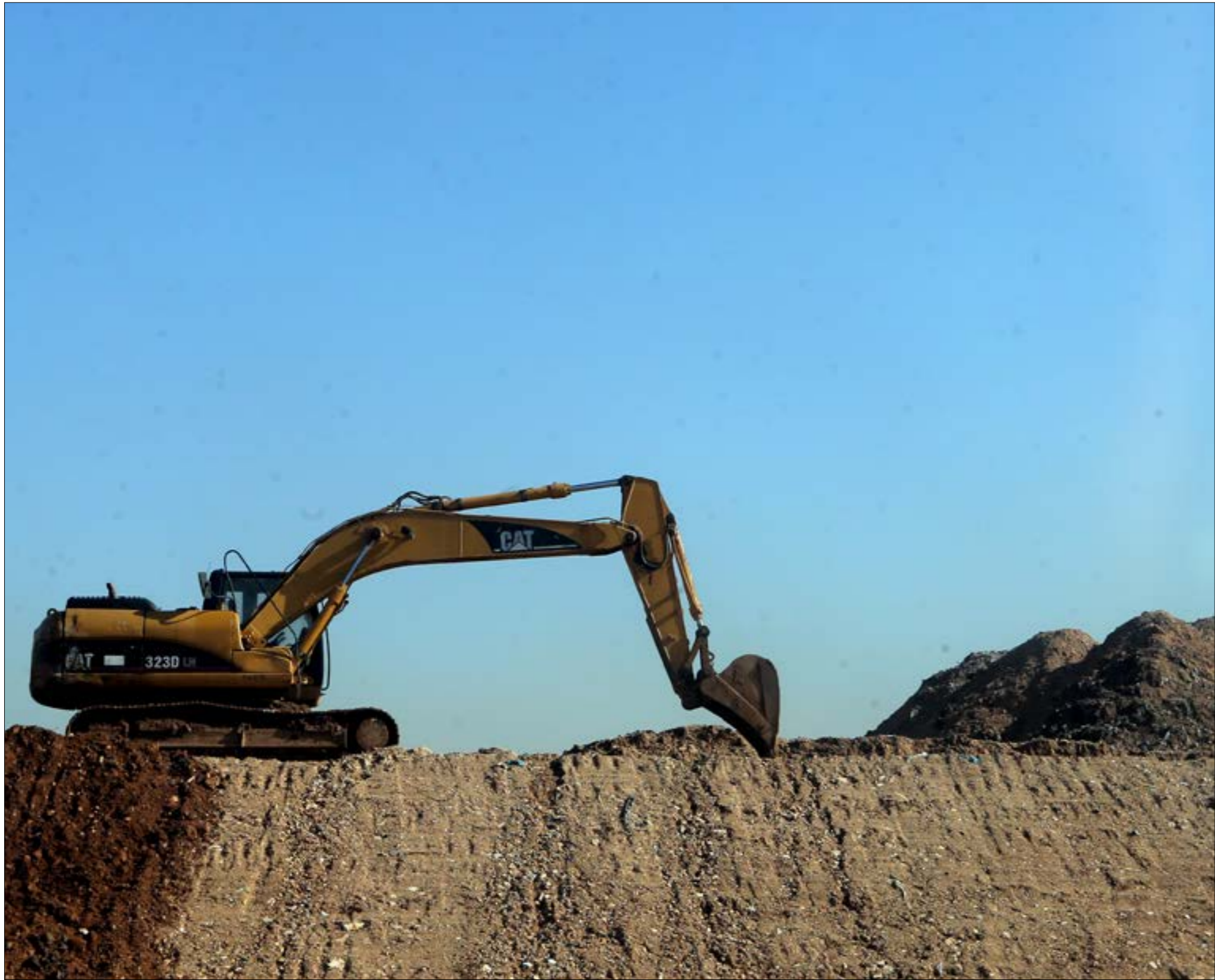
النفائيات التي تذهب إلى «كوستابرافا» حالياً أكثر بكثير مما هو محدد لها (هيلم الموسوي)